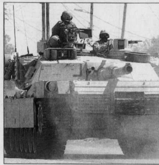
Un char américain à Najaf