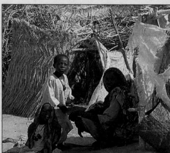
Les personnes déplacées (elles seraient un million) par le conflit ont été autorisées à rentrer chez elles.

Les Nations unies ont donné à Khartoum jusqu'au 30 août pour désarmer les milices arabes Janjawid, sous peine de sanctions diplomatiques et économiques. Jack Straw va aussi encourager le régime à conclure un accord politique avec deux groupes rebelles — l'Armée de libération du Soudan et le Mouvement Justice et Égalité —