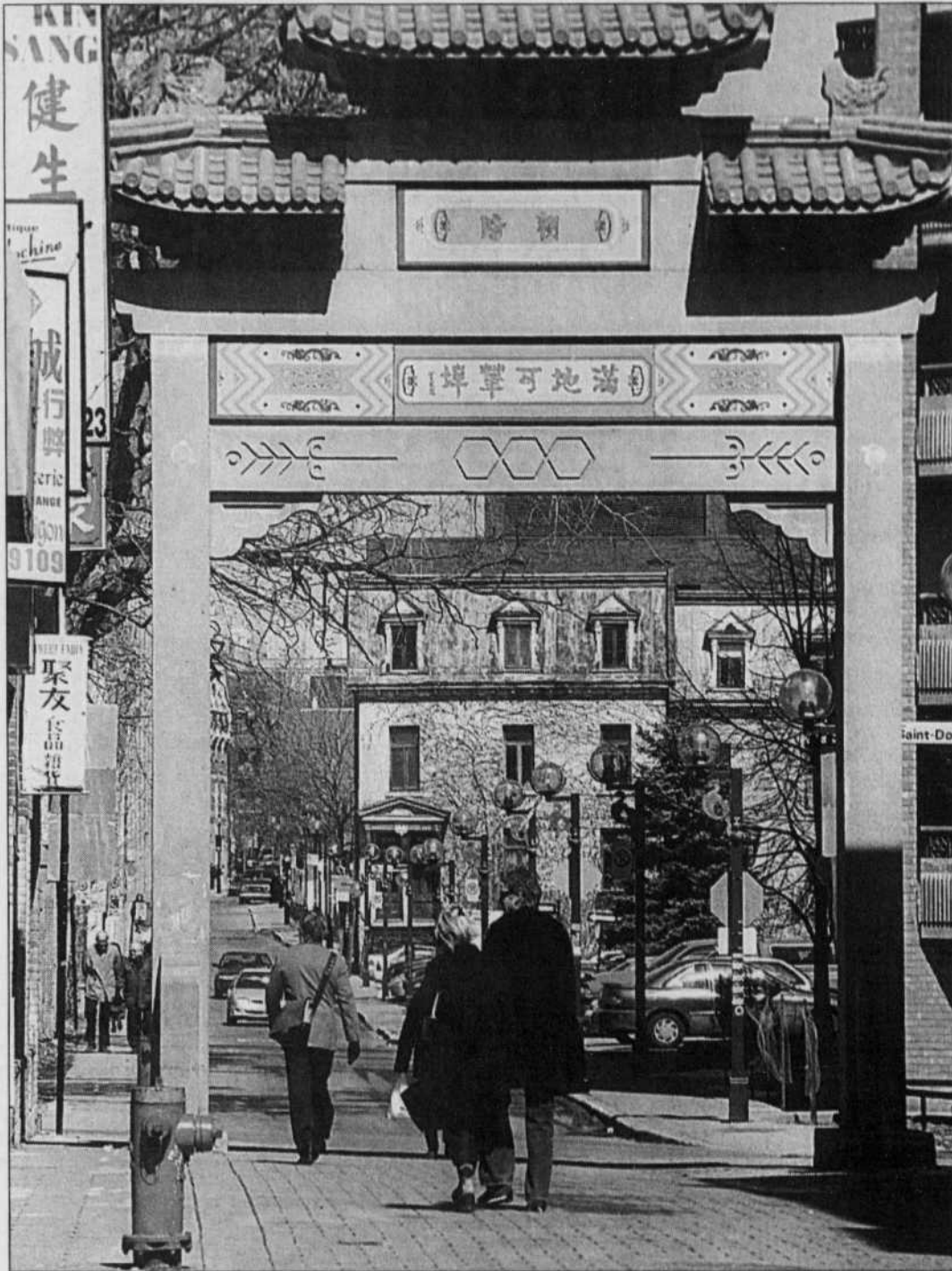
On doit rejeter le modèle traditionnel de l'État-nation ethnoculturellement homogène, au profit d'un État-nation pluriethnique et pluriculturel.

Une approche progressiste et cosmopolitique va de pair avec une redéfinition du rôle joué par les États-nations. On doit rejeter le modèle traditionnel de l'État-nation ethnoculturellement homogène, au profit d'un État-nation pluriethnique et pluriculturel. On doit accepter aussi d'autres modèles d'orga-