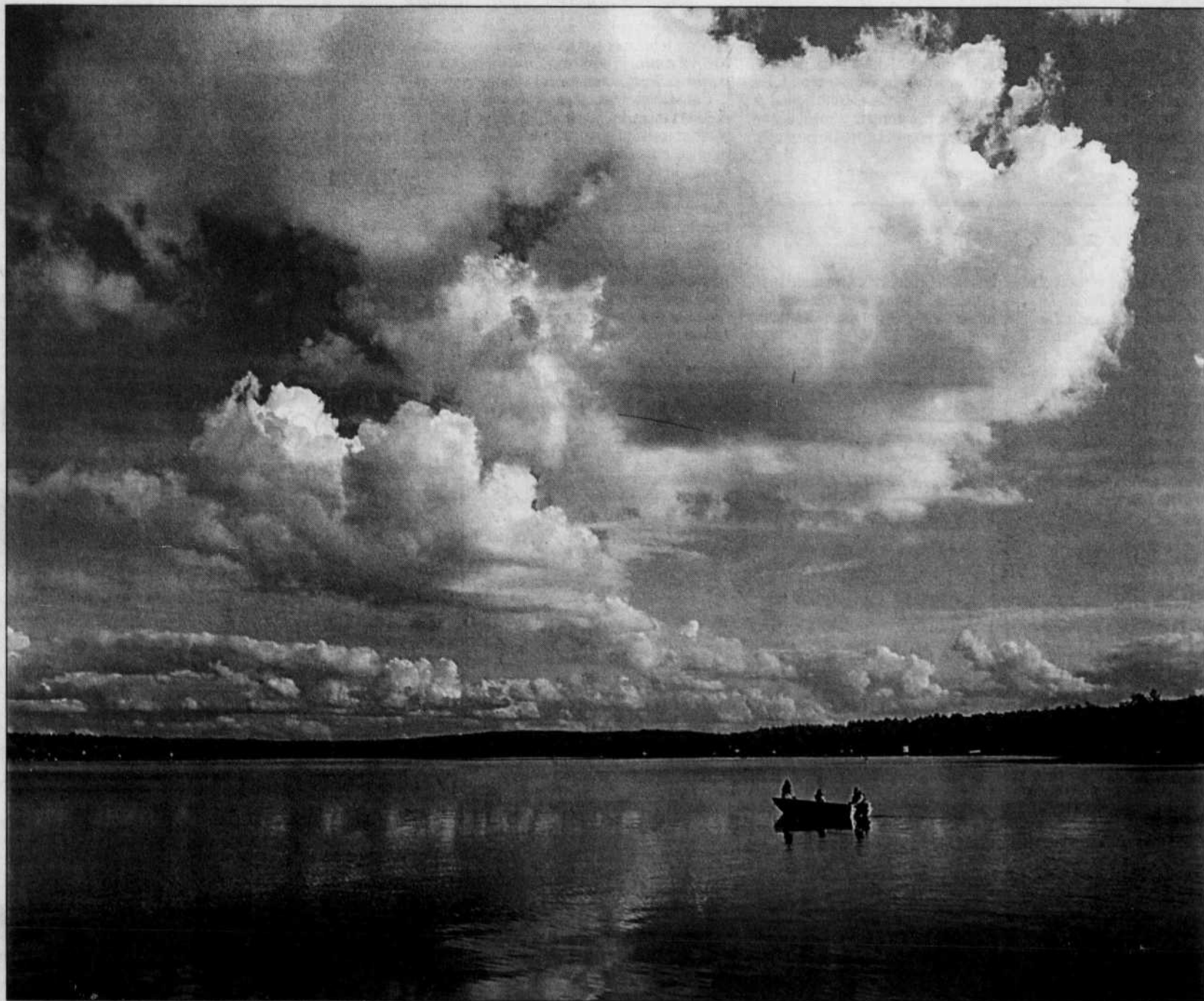
Le Lac des Abénaquis. Photographie tirée de Par monts et par vaux , par Claude Bouchard et Benoît Lacroix, Chaudière-Appalaches, Québec, Les Publications du Québec, collection «Coins de pays», 2004, 175 pages.