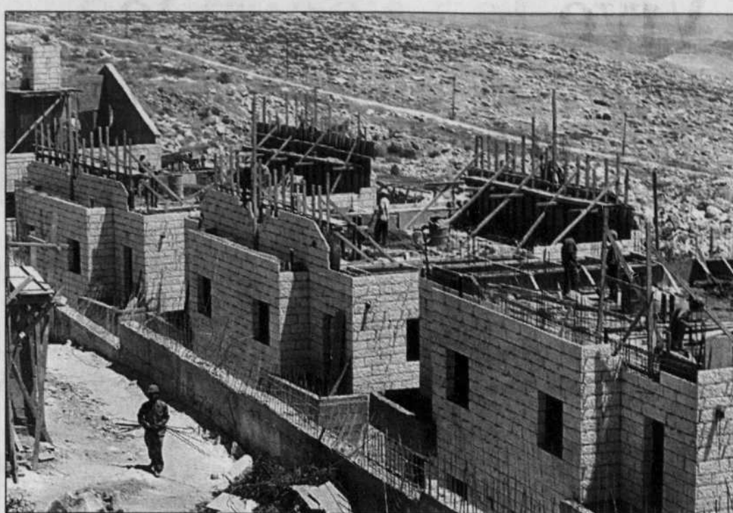
En dépit des projets d'Ariel Sharon, la construction de colonies se poursuit. Sur la photo, des maisons à la colonie Adam, près de Jérusalem.