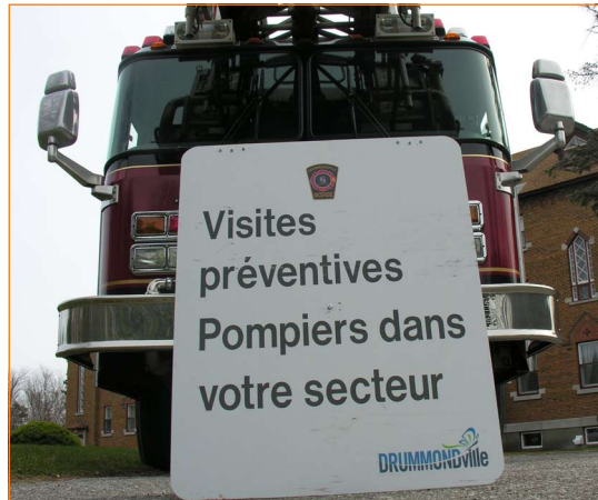
Des affiches sont placés en bordure de la route afin d'identifier le secteur où les pompiers effectuent leurs visites.

* Règlement municipal 3500, Titre IV, Section 1