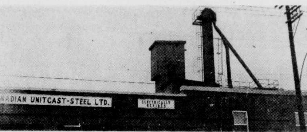
COMBAT A LA POLLUTION DE L'AIR — Les dirigeants de l'usine Canadian Unitcast-Steel de Sherbrooke viennent d'annoncer un projet de $50.000 en vue d'améliorer l'actuelle situation, à l'usine de l'intersection Belvédère et Galt ouest. Ci-haut, on voit la cheminée, qui ne crache pas son habituel nuage de poussière, ainsi qu'il en sera lorsque le dispositif aura été mis en place, au plus tard en octobre prochain.