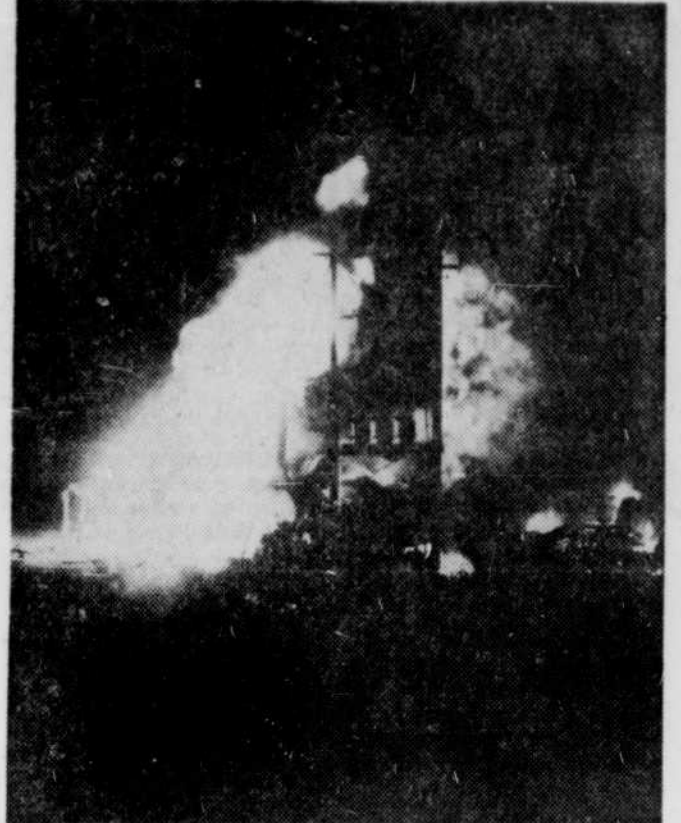
Les réservoirs à essence de la firme Seroc Inc. furent la proie des flammes dans la nuit de mercredi soir à jeudi midi. Ce sont les pompiers de Danville qui ont eu la tâche de surveiller l'incendie et de le maîtriser au maximum, mais il faut signaler que le feu était alimenté par quelque 7,000 gallons d'asphalte et 6,000 gallons de mazout. Les dommages s'élevaient à plus de $100,000. On compte parmi ces pertes les réservoirs de la Seroc et un camion de service appartenant également à la Seroc. Les pompiers de Danville ont pu retirer à temps une pelle mécanique propriété de la firme.