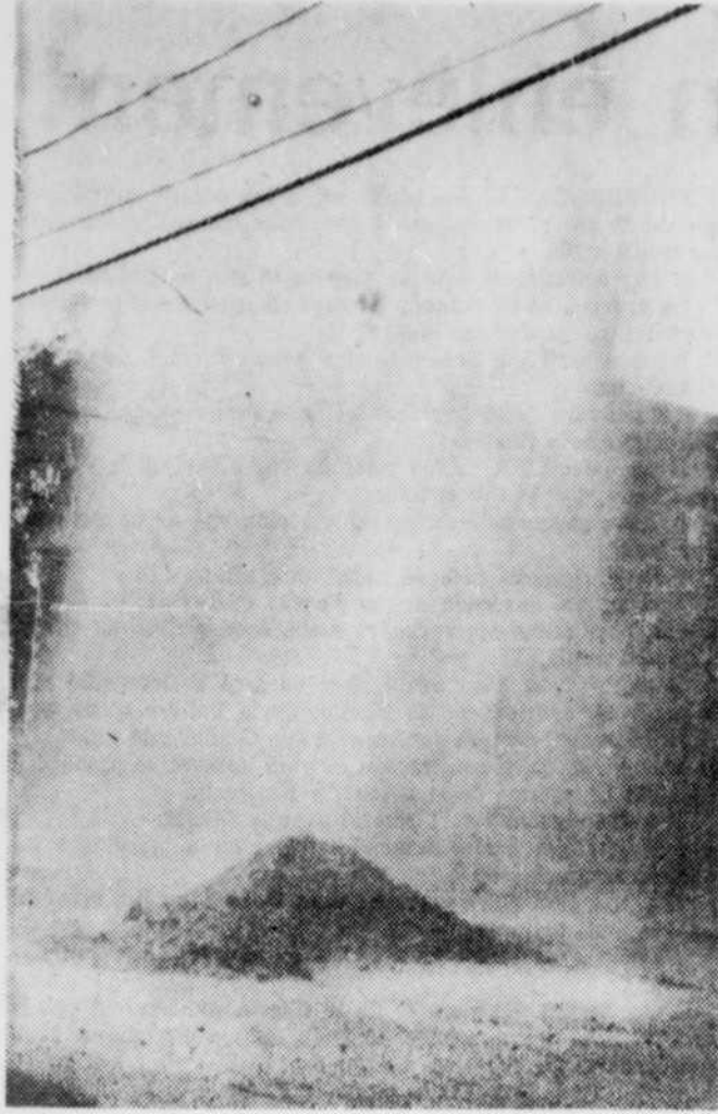
Un geyser impromptu a éclaté en plein centre d'une rue de Lac-Mégantic alors qu'on y effectuait certains travaux d'aqueduc.