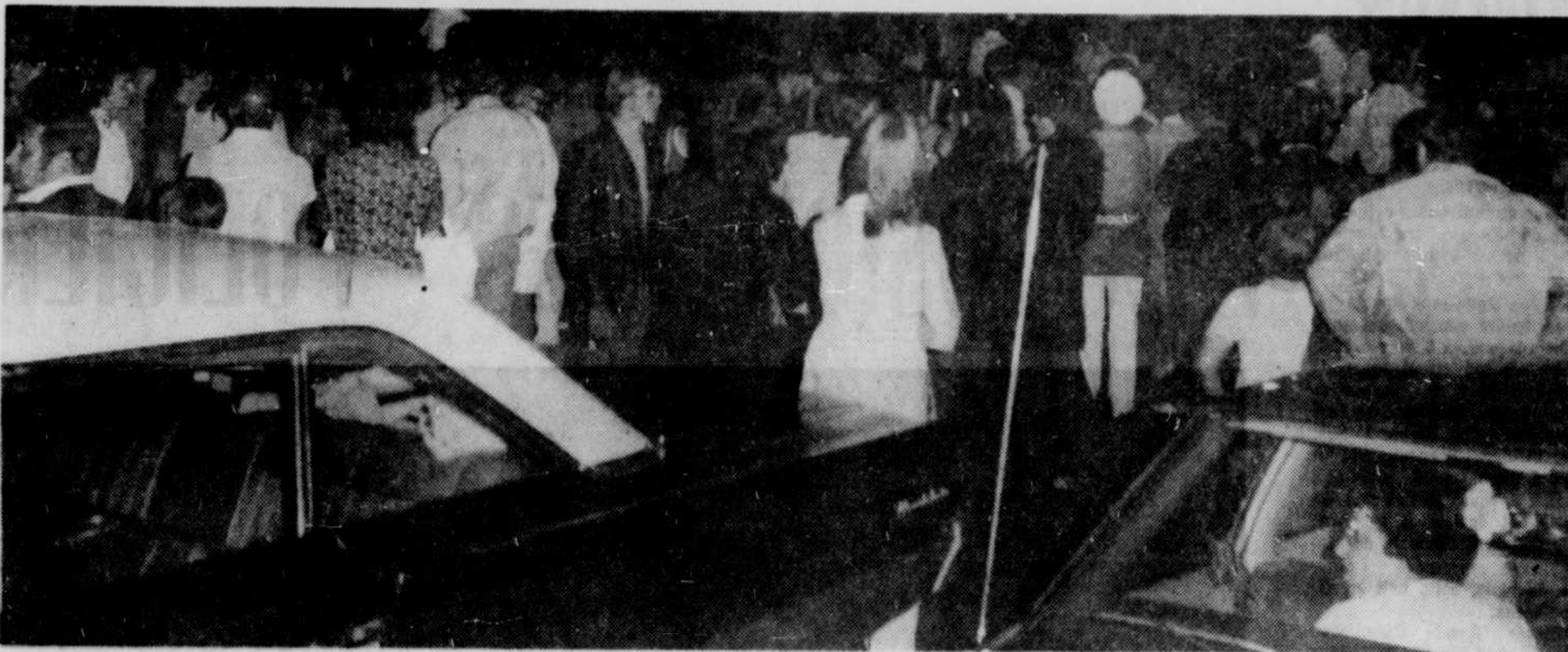
FÊTE DE LA ST-JEAN — Environ 20,000 personnes ont participé et assisté aux festivités de la St-Jean qui se sont déroulées jeudi soir dans la rue Lindsay à Drummondville. Quatre kiosques avaient été montés pour l'occasion, et ces derniers comme le démontre cette photo, ont grandement été appréciés par la population.