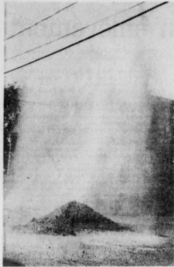
Un geyser imprévu a éclaté en plein centre d'une rue de Lac-Mégantic alors qu'on y effectuait certains travaux d'aqueduc.