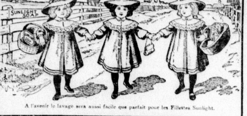
A l'avenir le lavage sera aussi facile que parfait pour les Fillettes Sunlight.