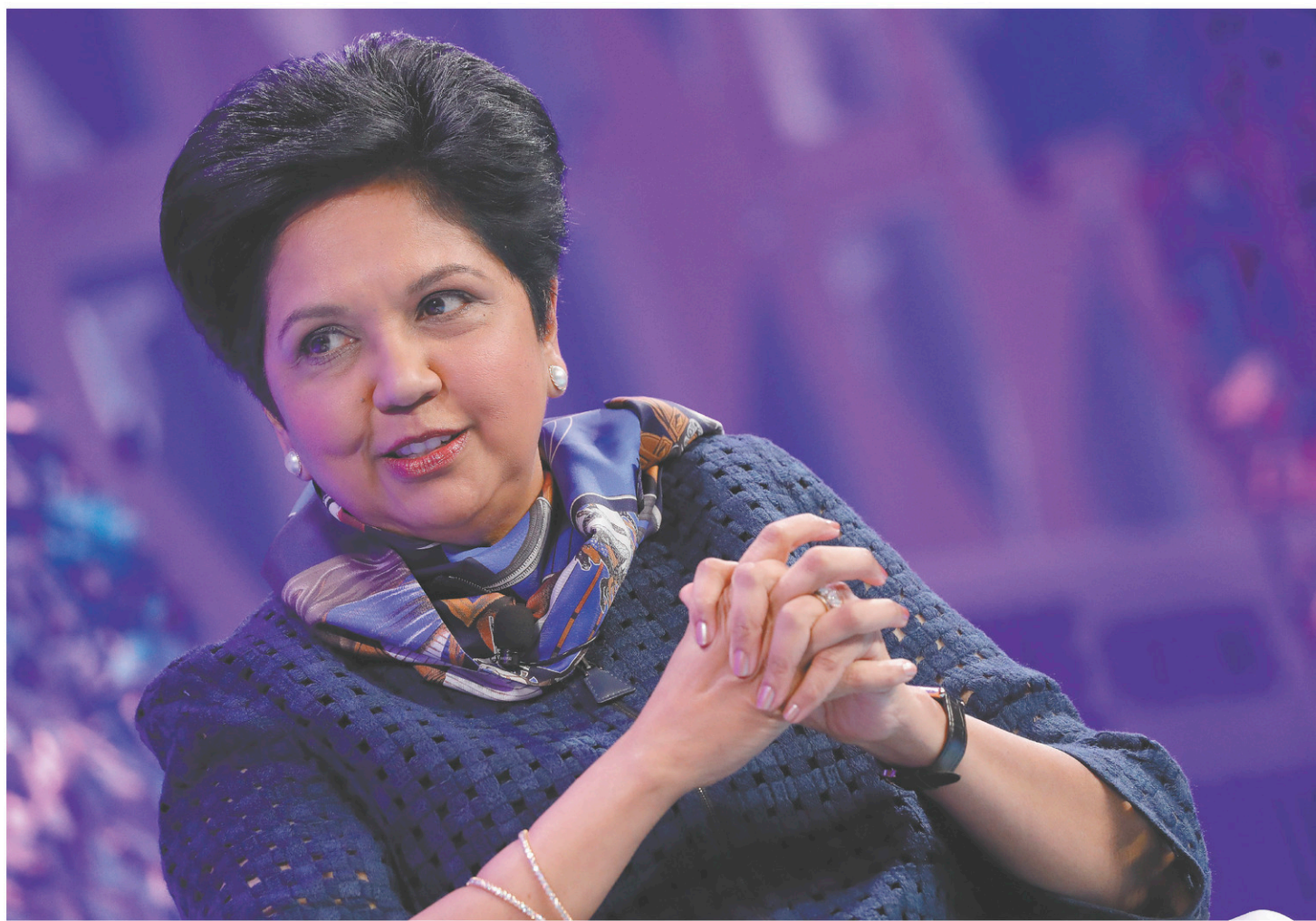
Indra Nooyi laisse un groupe ayant réalisé un chiffre d'affaires de 63,5 milliards l'an dernier et pesant près de 165 milliards en Bourse.