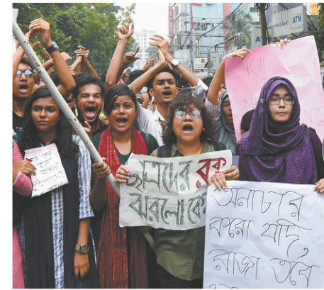
À Dacca, des heurts ont opposé lundi des centaines d'étudiants à la police, qui a utilisé des gaz lacrymogènes pour les disperser.

Attirant la presse étrangère et provoquant des critiques de l'ONU et d'associations de défense des droits de la personne, ces affrontements se sont transformés en véritable mise à l'épreuve pour le gouvernement de la première ministre Sheikh Hasina, à un peu moins de quatre mois des élections.