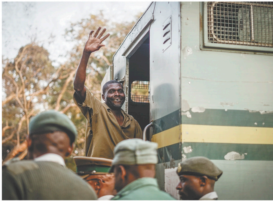
Un partisan du Mouvement pour le changement démocratique fait le geste symbolique de son parti alors qu'il est escorté du palais de justice à un camion de la police.

« C'est une situation inquiétante. Ils [policiers] vont dans les maisons, emmènent des gens vers des destinations inconnues. Ces gens ne sont pas conduits