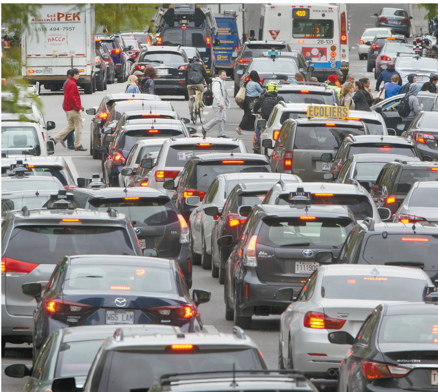
Le Canada et les États-Unis alignent leurs normes sur les émissions de gaz à effet de serre des véhicules depuis plus de deux décennies.

Le régulateur affirme que le verdict de première instance doit être annulé parce que le juge a ignoré des « principes fondamentaux de l'économie et du bon sens »