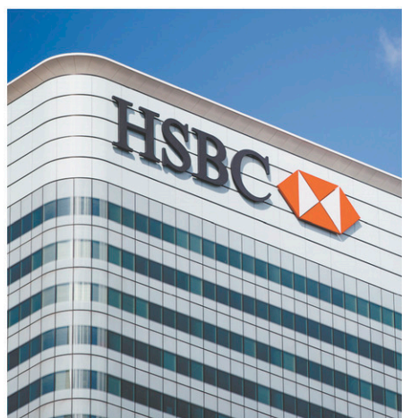
Ce transfert devrait être effectué durant le premier trimestre 2019, soit juste avant la sortie du Royaume-Uni de l'UE.

Les grands établissements financiers présents au Royaume-Uni ont beaucoup à perdre avec le Brexit, qui implique la fin du passeport financier européen. Ce précieux sésame leur permet de proposer leurs services sur tout le continent depuis le Royaume-Uni. Le projet du gouvernement britannique sur le Brexit, dont le volet sur les biens a été retoqué par Bruxelles, prévoit que le secteur des services, y compris financiers, ferait l'objet d'un nouvel accord qui doit entraîner davantage de barrières pour les banques.