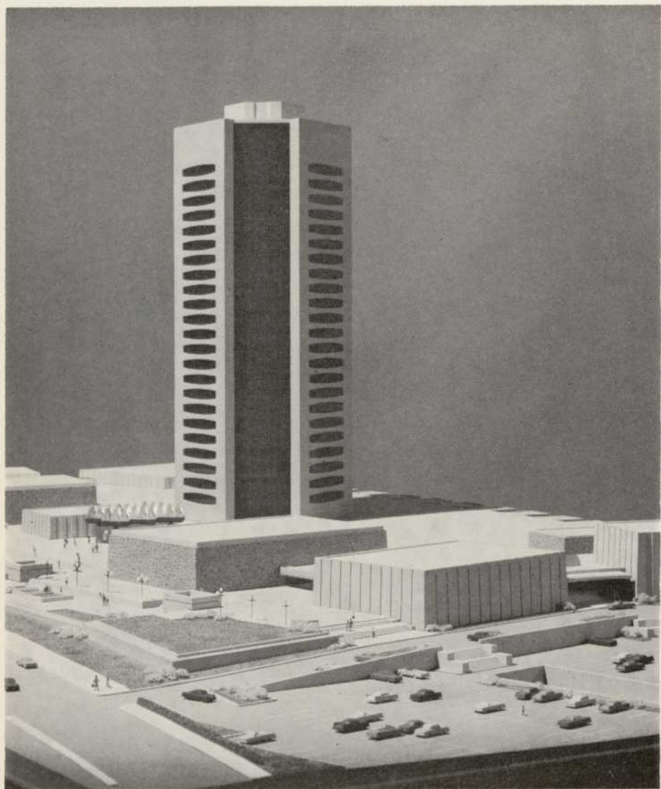
PLACE DE RADIO-CANADA, MONTRÉAL fin probable des travaux 1970 scheduled for completion