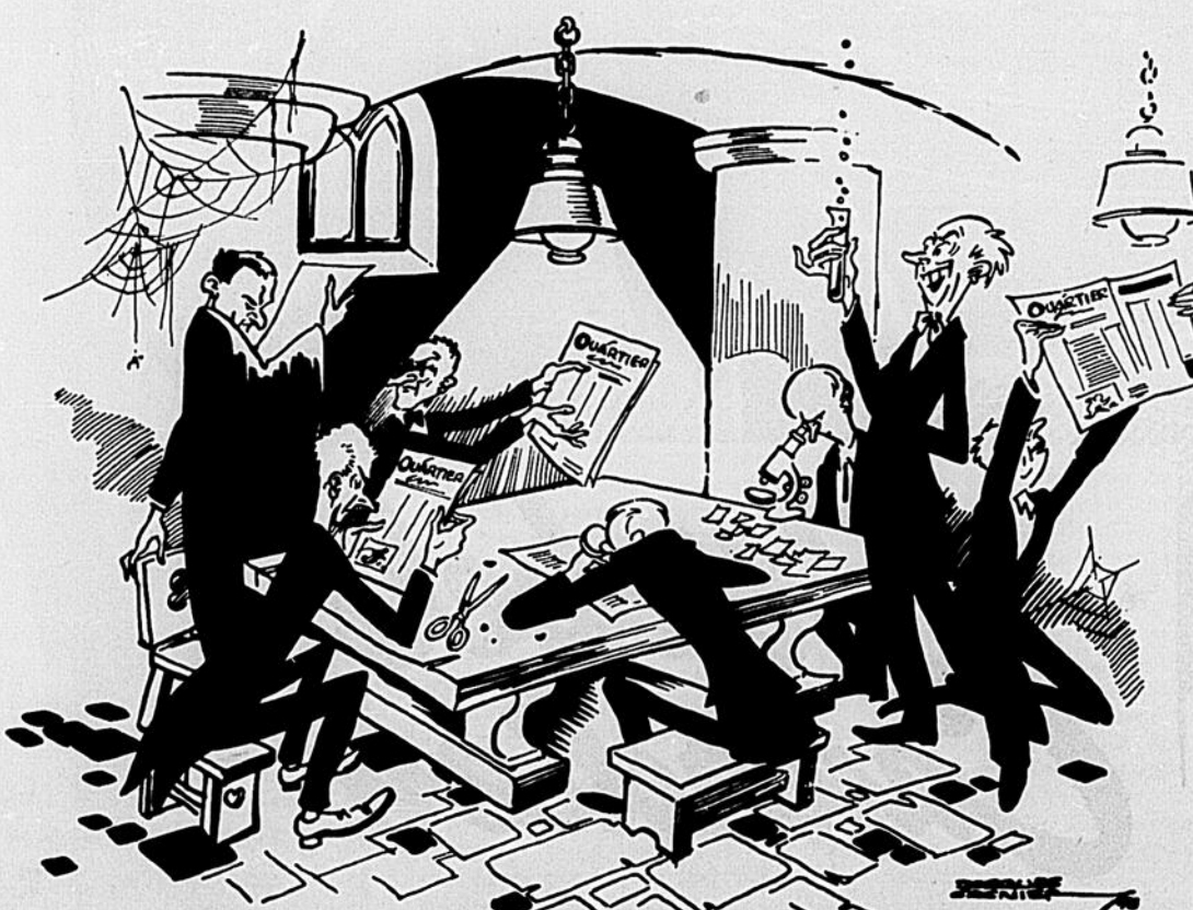
UN COMITÉ DE LECTEURS