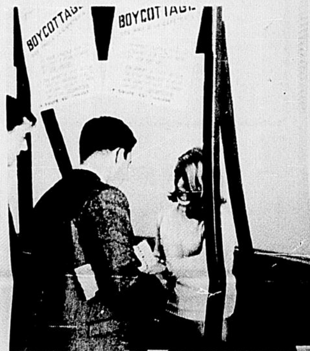
Un kiosque pour le p'tit change