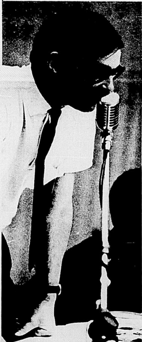
"L'ombre de la charte"

De toute façon, d'ici une semaine, l'ordre du jour sera terminé et l'on entend informer suffisamment les étudiants. Ceux-ci recevront bientôt toute la documentation nécessaire sur le contenu du Congrès.