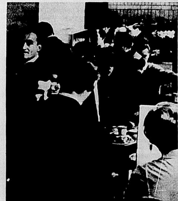
La cohue familière...