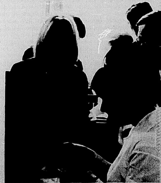
Et un beau sourire syndical.