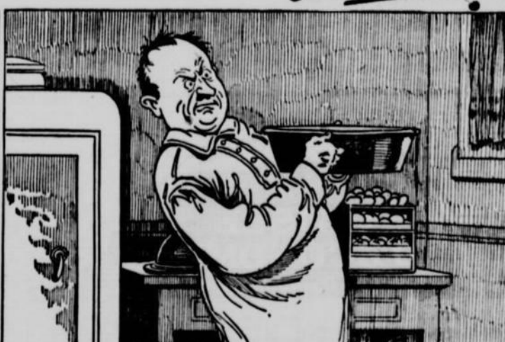
naturellement, tu trouves le bassin rempli à déborder, et il te faut faire des piroettes d'équilibre pour le transporter -