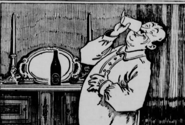
Tas pas ensuite pris une BLACK HORSE? Il n'y a que ça pour remettre daplomb!

Dites simplement - "Bière BLACK HORSE Dawes, s.v.p."