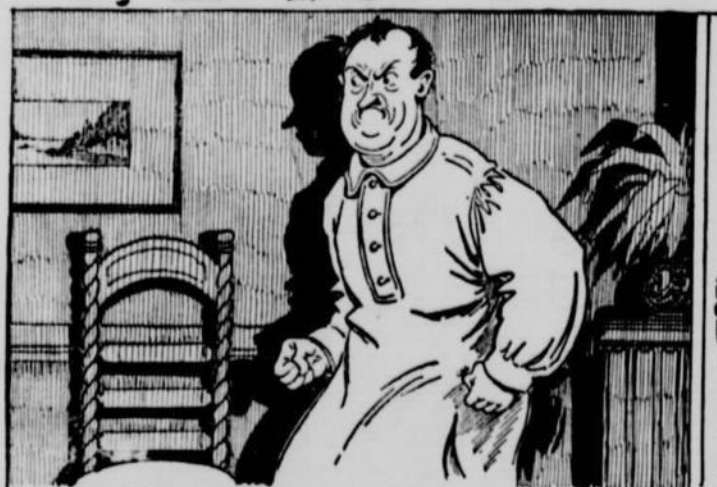
Tas pas déjà oublié de vider le bassin en dessous de la glacière - et ta femme te force à le lever du lit, d'y voir-