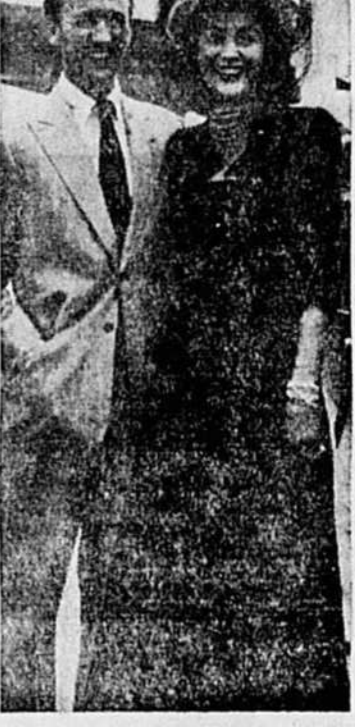
David Niven, acteur anglais bien connu, qui tiendra le premier rôle dans un film qui commencera à tourner bientôt.