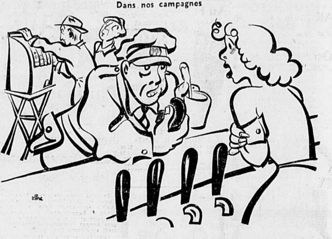
Le P. P. — "La loi est plus respectée! Y a une épidémie d'vols, de c'temps-citte!"