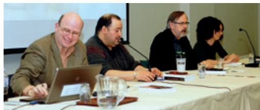
Soirée Vivre ensemble du 24 avril 2019.