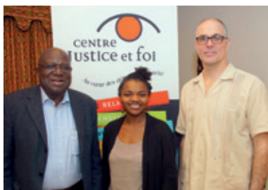
Soirée du 21 février 2019.