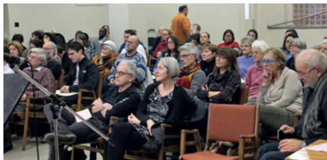
Soirée Vivre ensemble du 19 novembre 2018.

(en partenariat avec Les AmiEs de la Terre de Québec et avec la collaboration avec le Front commun pour la transition énergétique et le Comité pour les droits humains en Amérique latine)