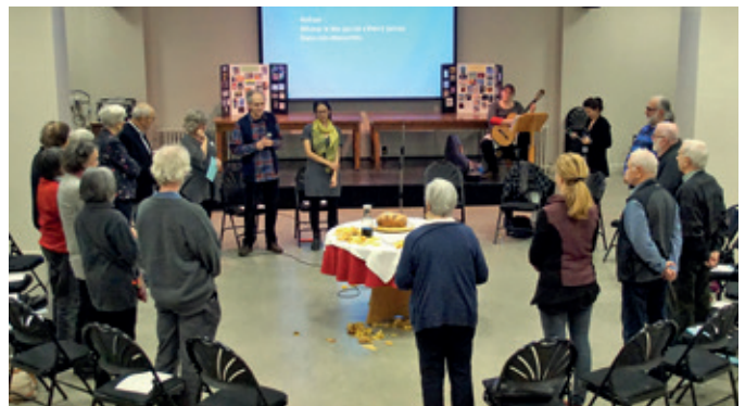
Soirée Saisons Emmaüs du 4 novembre 2018.

La saison de l'automne a eu lieu le 4 novembre 2018 («Tenir dans la joie») et celle du printemps le 7 avril 2019 («Lier. Relier.») a porté sur la joie des rassemblements. Les rencontres ont réuni respectivement une vingtaine et une trentaine de personnes. Le 10 mai 2019, une rencontre de consultation a eu lieu pour réfléchir à la suite et à la formule des Saisons Emmaüs.