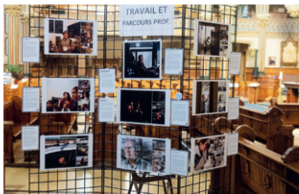
Exposition «QuébécoisEs, musulmanEs... et après?», église Saint-Édouard, le 16 septembre 2018.