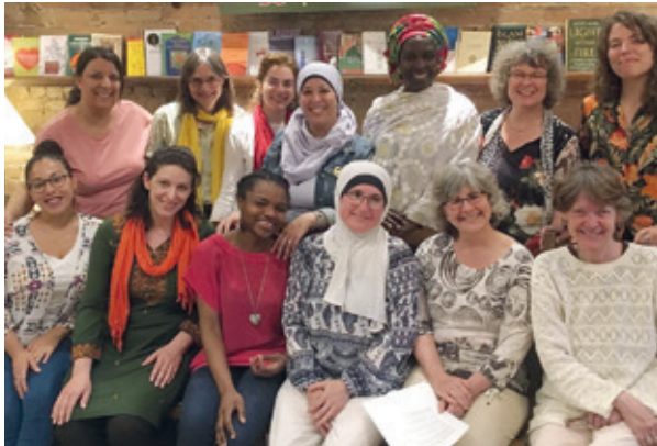
Rencontre Maria'M du 6 juin 2019.

Le groupe a organisé deux dialogues : 1) «Le rapport au corps des femmes» (7 mars 2019) tenu au Centre justice et foi, visant à approfondir les enjeux liés au rapport au corps et à la sexualité des femmes et comment cette question est traitée dans nos traditions religieuses; 3) «L'hospitalité» (6 juin 2019) qui a eu lieu au café Floraison, une initiative d'une communauté soufie qui offre un espace ouvert à tous et toutes permettant de valoriser la rencontre et la quête spirituelle.