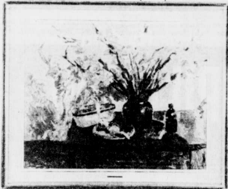
«Les glaieuls» de Goodridge Roberts

C'est la première fois que cette collection est présentée en dehors des murs de l'édifice bien connu. Pour le président Claude Castonguay et son équipe, c'était le moyen le plus spectaculaire de fêter les 50 d'existence de cette compagnie qui étend ses ramifications en Ontario, au Nouveau-Brunswick et partout au Canada.