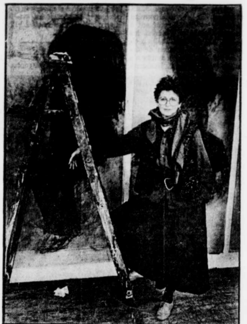
L'exposition de Betty Goodwin (ici dans son atelier) culmine avec « Carbon », où le rapprochement des figures (devenues de denses masses noires) ne fait qu'accentuer, cruellement, leur isolement psychique.

Depuis l'inauguration, dans la métropole, de la dernière étape de son exposition itinérante, Betty Goodwin respire enfin. Car maintenant, elle se permet de refuser systématiquement mondanités et entrevues, des « épreuves » pour cette créatrice plus à l'aise dans la quietude de son atelier que sous les feux des projecteurs! « Il est temps que je me remette sérieusement au travail », aurait-elle déclaré. C'est qu'à 64 ans, Betty Goodwin a encore beaucoup à dire... ♦