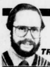
par Régis TREMBLAY

C'est ce soir-là seulement que sera présenté à Québec le travail de toute une année de notre troupe professionnelle de danse moderne.