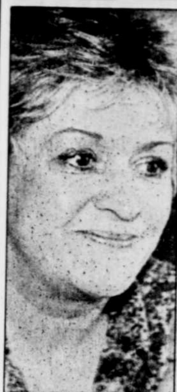
Le Soleil, Roland Marcoux