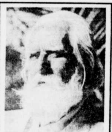
Omraam Mikhaël Aïvankov