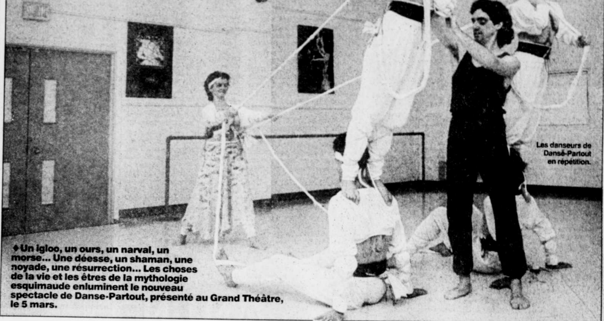
Les danseurs de Danse-Partout en répétition.

♦ Un igloo, un ours, un narval, un morse... Une déesse, un shaman, une noyade, une résurrection... Les choses de la vie et les êtres de la mythologie esquimaude enluminent le nouveau spectacle de Danse-Partout, présenté au Grand Théâtre, le 5 mars.