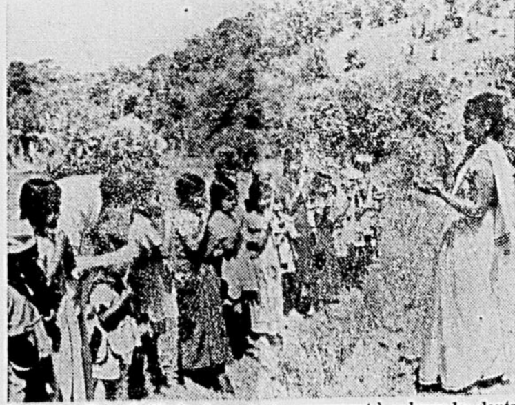
Dans un village de l'Inde, des enfants apprennent à se laver les dents avec un bout de bois et de la poudre dentifrice faite de charbon de bois. Leurs instructeurs sont des spécialistes du service de santé envoyés par l'Organisation mondiale de la santé (OMS) et le Fonds international de secours à l'enfance (UNICEF) pour combattre la malaria. Ces spécialistes s'arrêtent souvent dans les villages pour apprendre aux enfants à se laver les dents avec le matériel qu'ils peuvent trouver sur place, ce qui est une mesure contre la malaria.

menté de 192 millions au cours de l'année et ils sont plus du double de ce qu'ils étaient à la même date, en 1940. Les écritures au débit des comptes des clients, reflétant la grande activité du mouvement des affaires, ont atteint 28,460 millions de dollars pendant les quatre premiers mois de cette année, à rapprocher de 27,040 millions pendant la période correspondante de 1949. Les placements des banques à charte en valeurs mobilières de toutes catégories, en progression de 168 millions depuis un an, formaient une somme de 4,453 millions, soit l'équivalent de 50 pour cent de l'actif total.