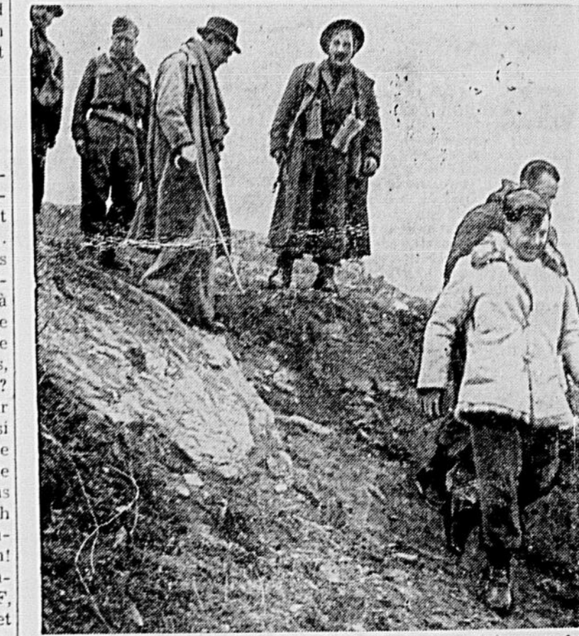
Des membres de la Commission spéciale des Nations Unies pour les Balkans franchissent un passage difficile dans les montagnes du Nord de la Grèce au cours d'une récente tournée d'inspection. Les observateurs de la Commission surveillent sans arrêt les frontières entre la Grèce, d'une part, l'Albanie, la Bulgarie et la Yougoslavie, de l'autre, et rendent compte à la Commission des incidents constatés.