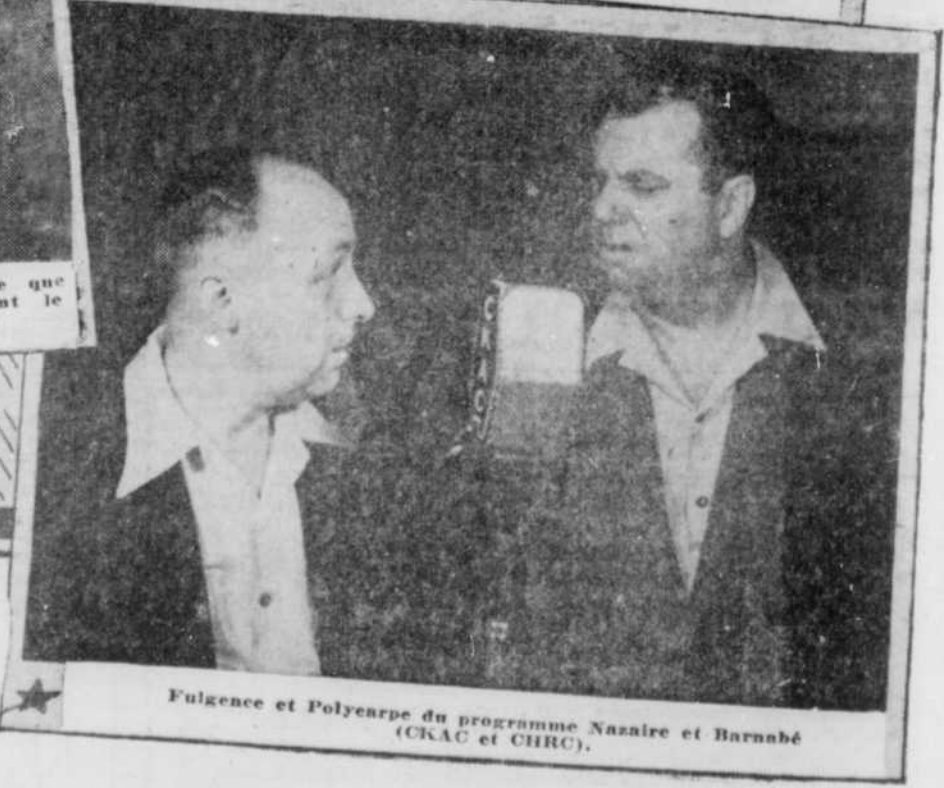
★ Fulgence et Polycarpe du programme Nazaire et Barnabé (CKAC et CHRC).