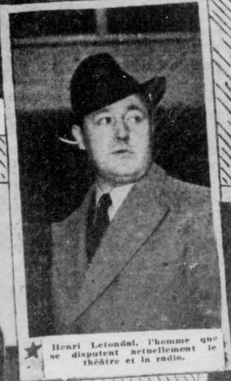
★ Henri Letondal, l'homme que se disputent actuellement le théâtre et la radio.