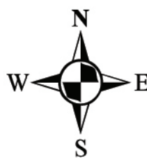
CARTE 2 Territoires forestiers internes et externes du Parc national du Bic