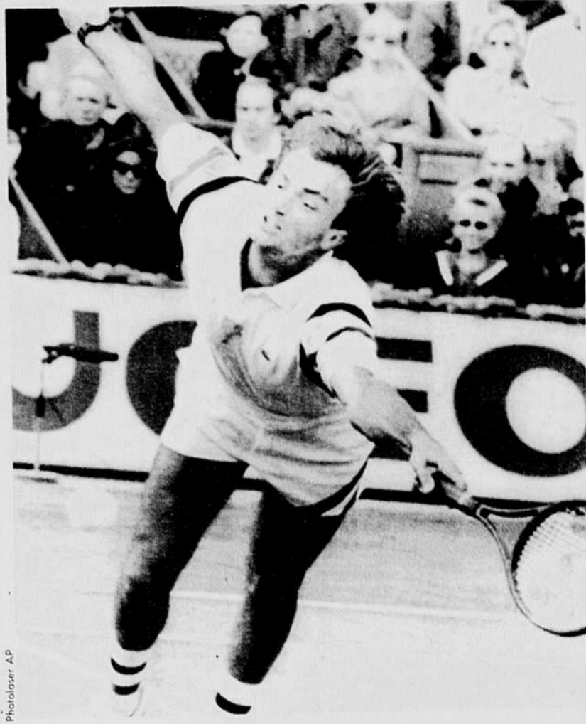
Stimulé par une foule partisane, le Français Henri Leconte a multiplié les jeux spectaculaires hier.

Menée 4-1 par la Péruvienne Laura Gildemeister, la dernière à l'avoir battue cette année, Monica Seles s'est brutalement réveillée et a gagné les 11 jeux suivants. Et le match. Son éventuelle demi-finale avec la petite Américaine Jennifer Capriati fait déjà rêver tout Roland-Garros.