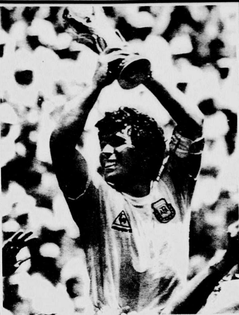
Diego Maradona alors qu'il était porté en triomphe après avoir mené l'Argentine à la victoire lors du Mondiale de 1986.