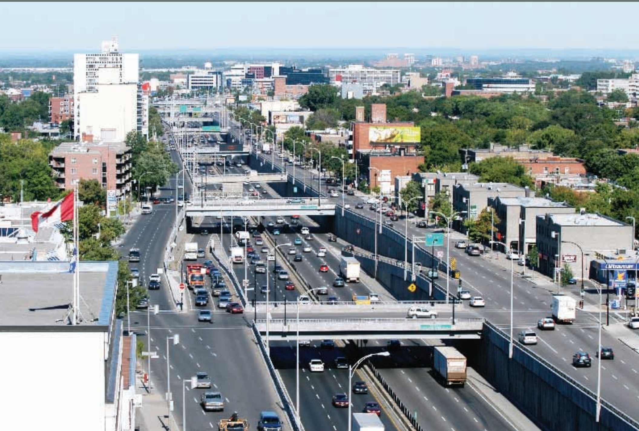
Autoroute Décarie Nord