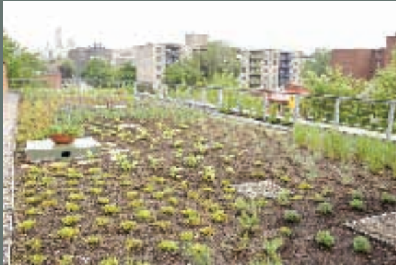
Maison de la culture Côte-des-Neiges - Toit vert