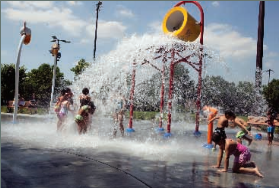
Jeux d'eau - Parc de Kent