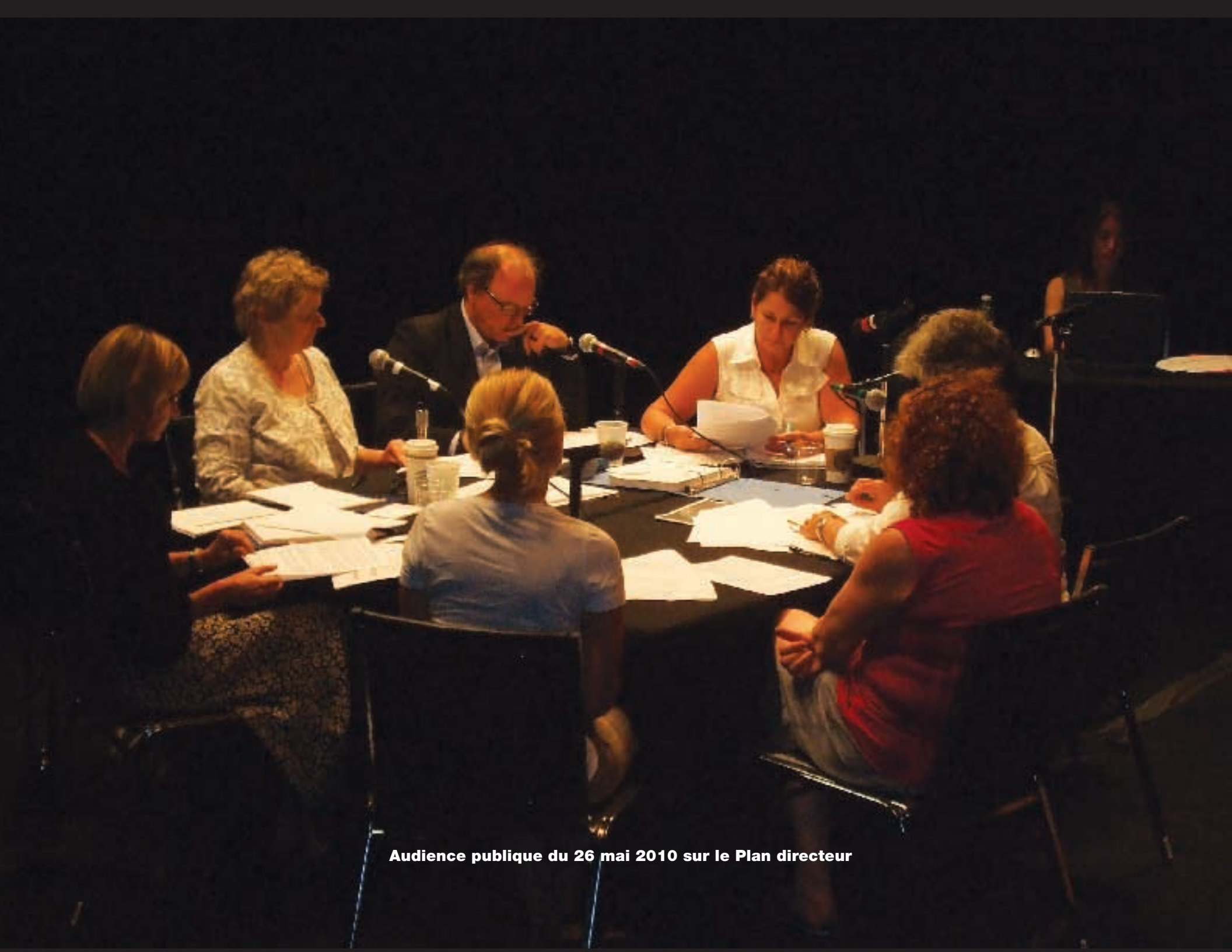
Audience publique du 26 mai 2010 sur le Plan directeur