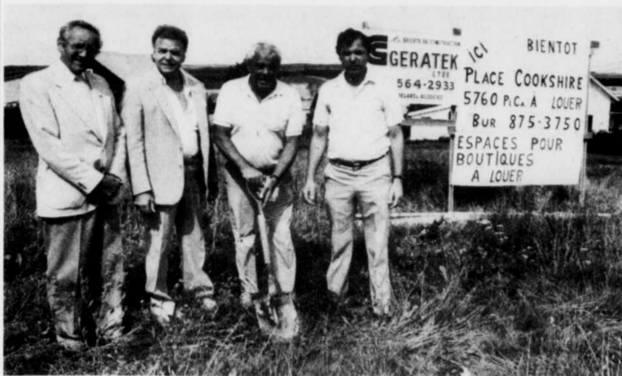
Centre commercial à Cookshire