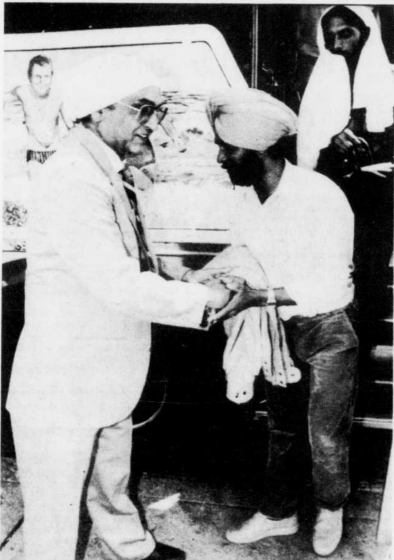
Un réfugié est accueilli à sa descente de l'autobus à Toronto par un membre de la communauté sikhe. Deux autobus sont arrivés hier en provenance de Halifax.

"Le discours de M. Bourassa revient à nous demander de compter sur la bonne foi de nos gouvernements provinciaux. Pourtant, l'histoire démontre qu'ils n'ont jamais été généreux envers nous", a commenté hier le professeur Hébert, spécialiste en sciences politiques et membre de la Société franco-manitobaine.