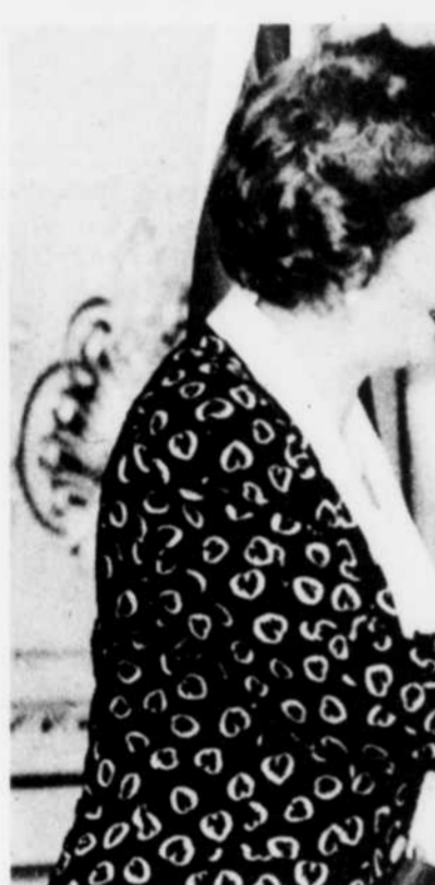
Le président français François Mitterrand et la première ministre britannique Margaret Thatcher, échangent une chaleureuse poignée de

Puis Mme Thatcher a annoncé "la volonté commune" des deux