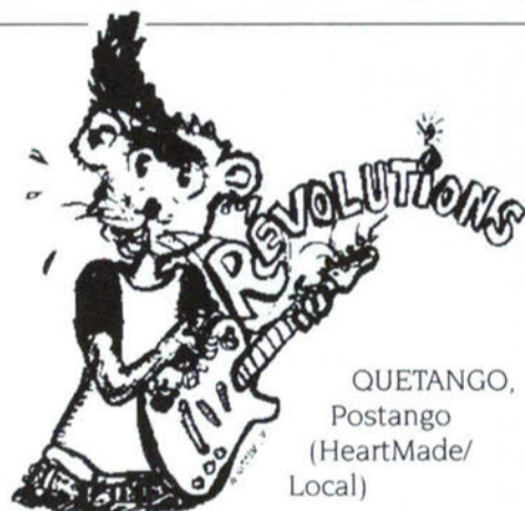
QUETANGO, Postango (HeartMade/ Local)