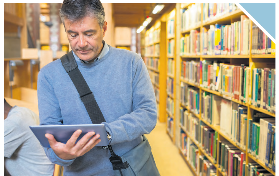
Les FGA sont une opportunité pour renforcer son CV.