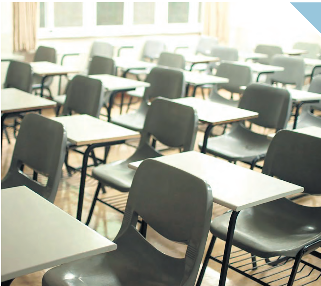
L'institut de coopération pour l'éducation des adultes veut voir plus d'investissements ciblés.

En ce qui concerne les personnes immigrantes, le gouvernement investit 164,1 millions de dollars pour accélérer la reconnaissance de leurs compétences, avec des initiatives