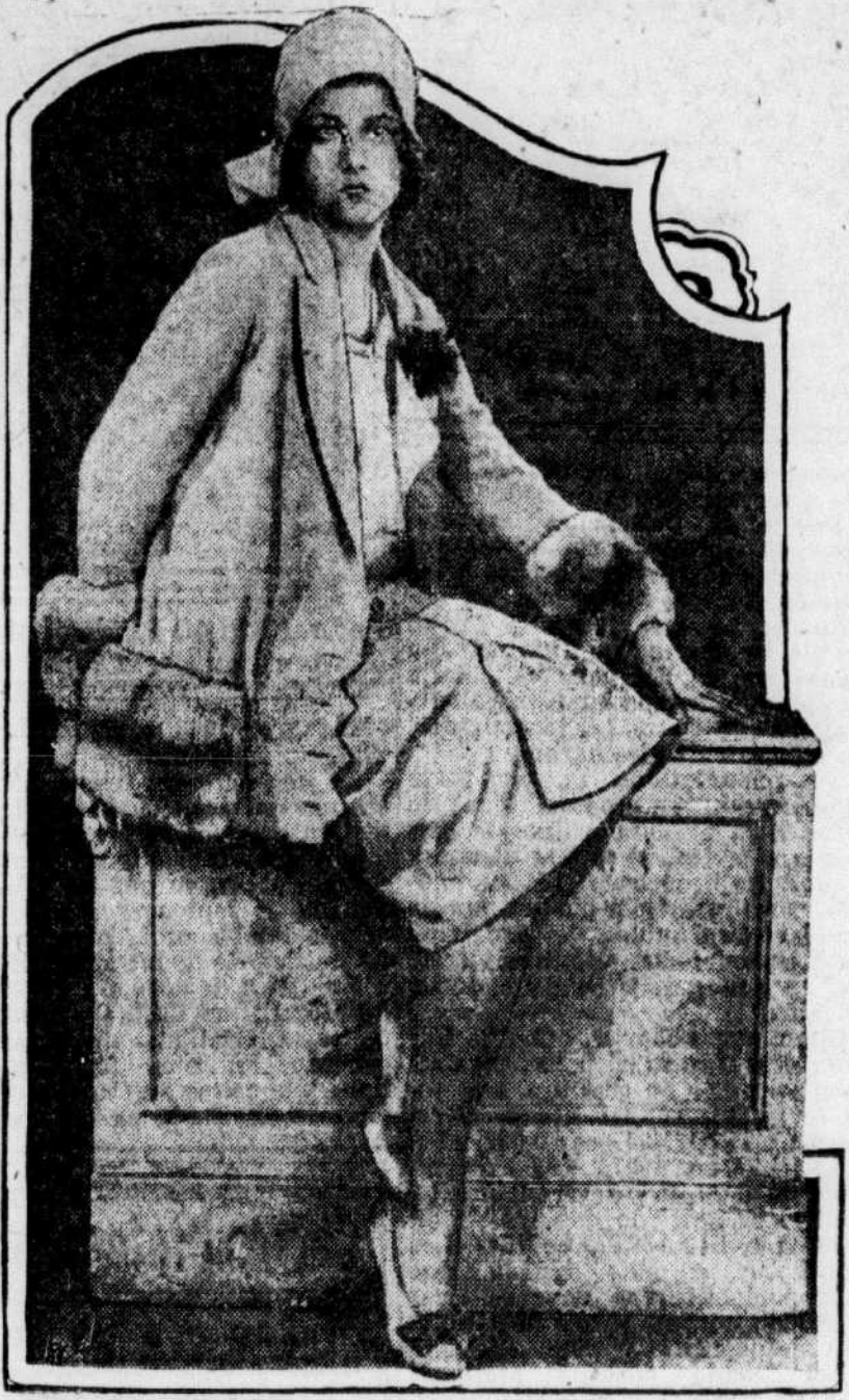
Voici un élégant petit costume d'automne en broadcloth aquamarine richement orné de renard rouge.