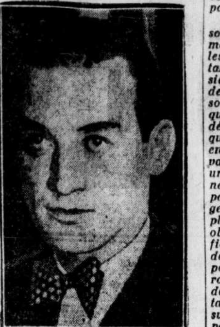
LORD GLENCONNER, en visite au Canada.

Parmi toutes ces paroisses qui rivalisent, celle de Dupuy a été érigée canoniquement en 1919 et civilement en 1920. Son territoire comprend une partie des cantons de La Reine et de Desmetolles. Il peut y avoir dans cette paroisse seule environ quatre cents lots propres à la culture dont une centaine seulement sont occupés.