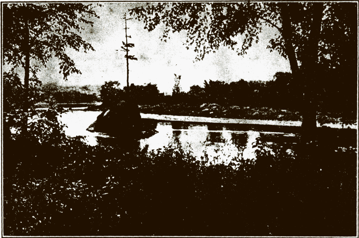
LE ROCHER AU PIN — SHERBROOKE

Bulletin officiel de la Société de Généalogie des Cantons de l'Est Inc.