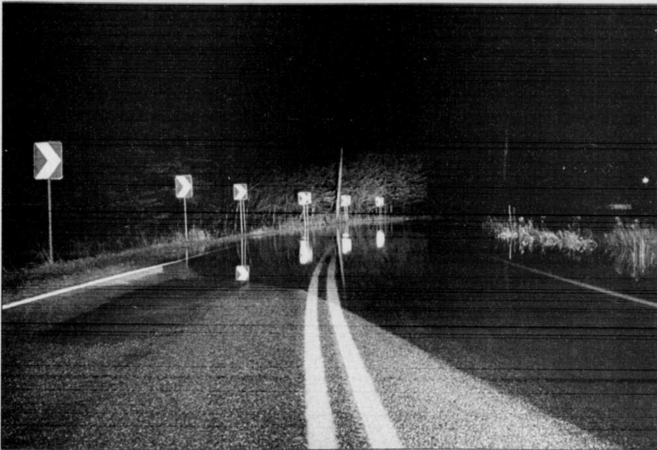
Les deux routes longeant la rivière Jacques-Cartier, à Shannon et à Sainte-Catherine-de-la-Jacques-Cartier, ont été inondées pendant quelques heures pendant la nuit de samedi à hier, forçant l'évacuation d'une centaine de personnes.