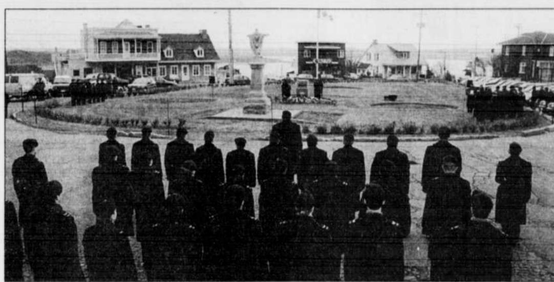
Beauport a tenu une cérémonie commémorative au pied du Cénotaphe de la paroisse de Courville, hier.

Plusieurs cérémonies sont prévues aujourd'hui