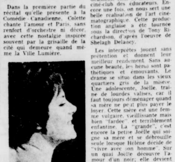
Colette Renard, c'est le grand art!

Colette Renard est une diseuse impeccable MONTREAL (CPC) — Une artiste qui possède un métier sûr, une diseuse impeccable, telle est, selon la critique, Colette Renard, interprète de la chanson française dont la tradition remonte à des centaines d'années. Dans la première partie du récital qu'elle présente à la Comédie-Canadienne, Colette chante l'amour et Paris, sans renfort d'orchestre ni décor, avec cette nostalgie inspirée souvent par la grisaille de la cité qui demeure quand même la Ville Lumière.