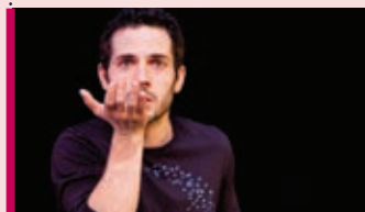
Les 3 exils de Christian E Théâtre 13 décembre – 20 h SPL

Ciné-Groulx présente une programmation surprenante de films et documentaires à la nouvelle salle Pierre Legault à Rosemère. Voyez la programmation complète en ligne.