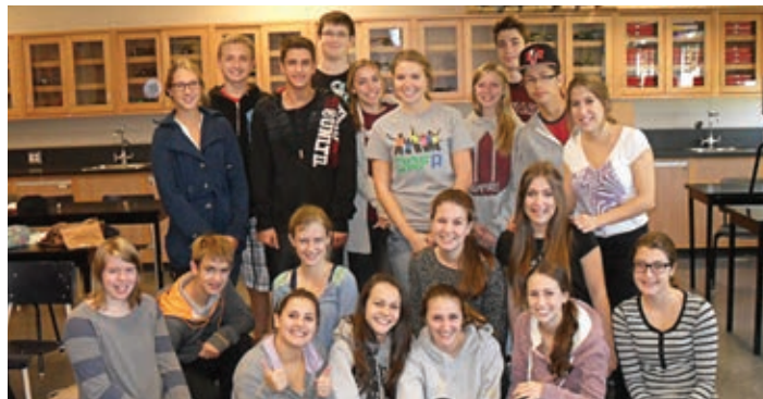
La première cohorte de diplômés DAFA compte 21 aspirants animateurs.