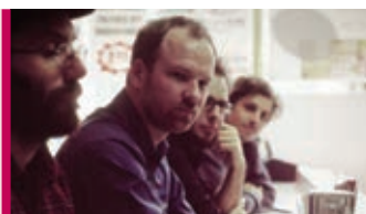
Avec pas d'casque 21 novembre – 20 h ESC