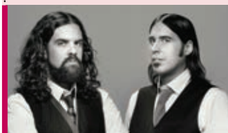
Les Denis Drolet 30 novembre – 20 h SPL