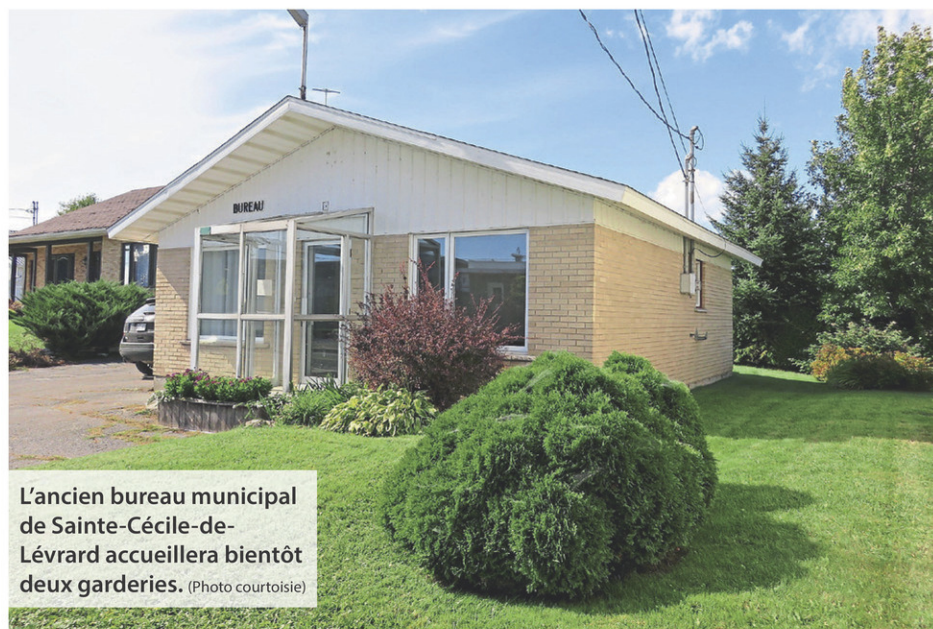
L'ancien bureau municipal de Sainte-Cécile-de-Lévrard accueillera bientôt deux garderies.

Les familles de Sainte-Cécile-de-Lévrard auront priorité dans l'attribution des places. Celles des municipalités avoisinantes pourront aussi bénéficier du