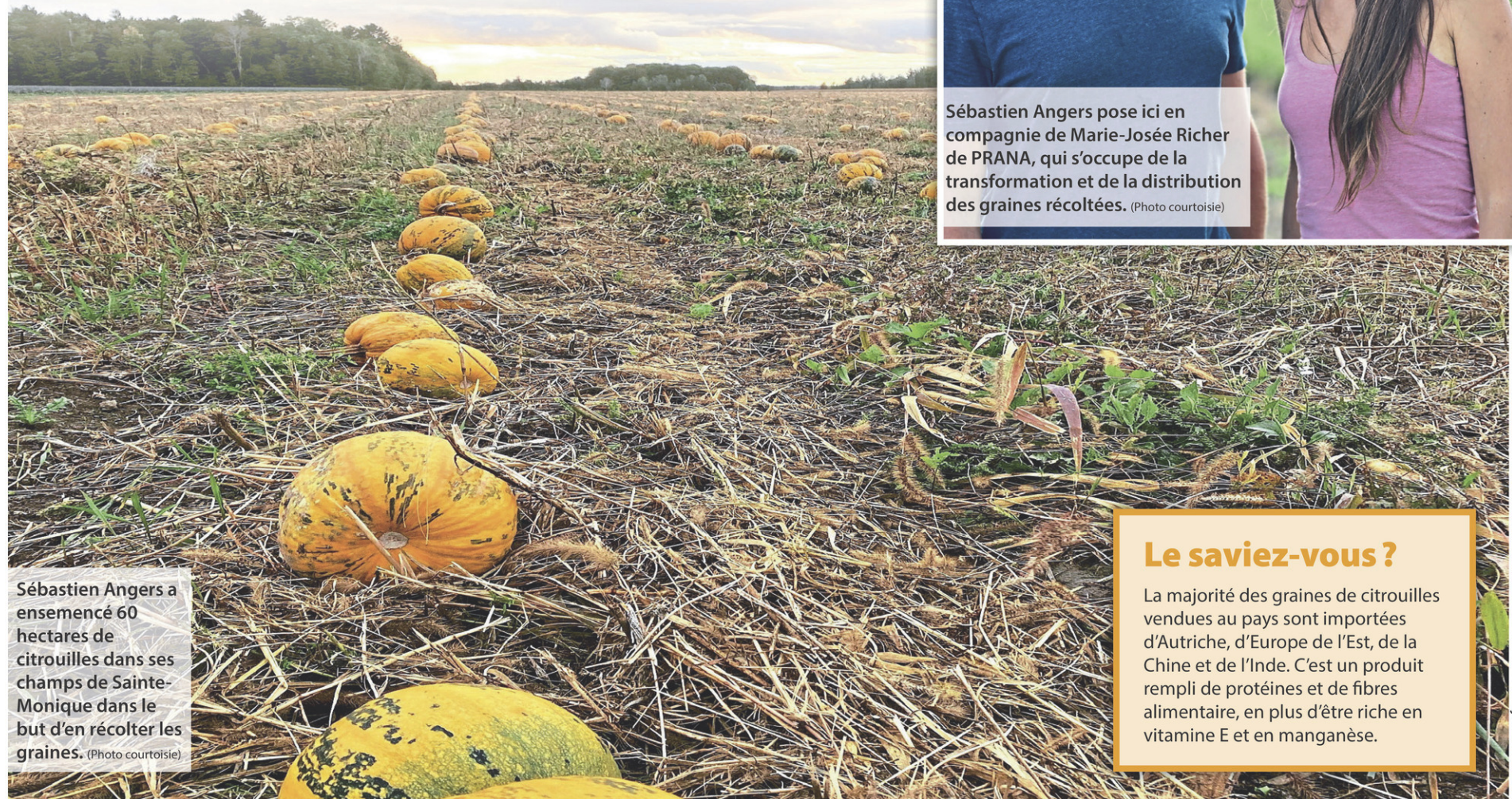
Sébastien Angers a ensemencé 60 hectares de citrouilles dans ses champs de Sainte-Monique dans le but d'en récolter les graines.