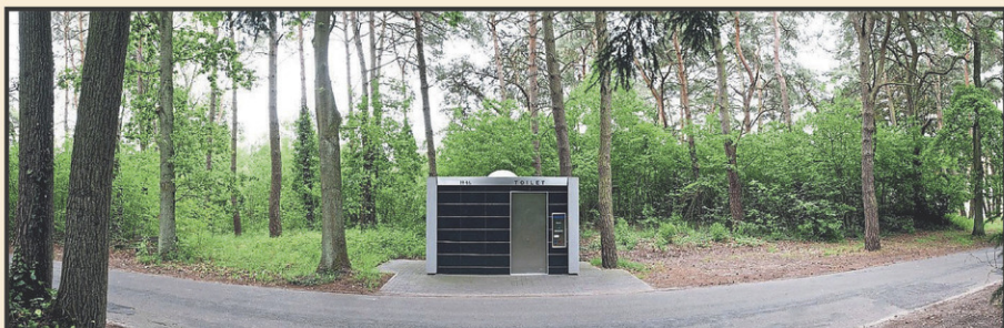
Voici la maquette du projet de halte de la municipalité de Sainte-Eulalie.

Rappelons que Sainte-Eulalie est la deuxième municipalité de tout le territoire de Nicolet-Bécancour à avoir obtenu le titre de village-relais, après Nicolet. Cette appellation est accordée par le ministère des Transports du Québec à des municipalités de moins de 10 000 habitants ayant démontré de l'intérêt à l'obtenir, et ayant la capacité d'offrir une diversité de services et un lieu d'arrêt agréable et sécuritaire aux voyageurs. Plusieurs critères sont scrupuleusement évalués avant l'octroi du titre.