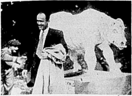
Le président riait . . .