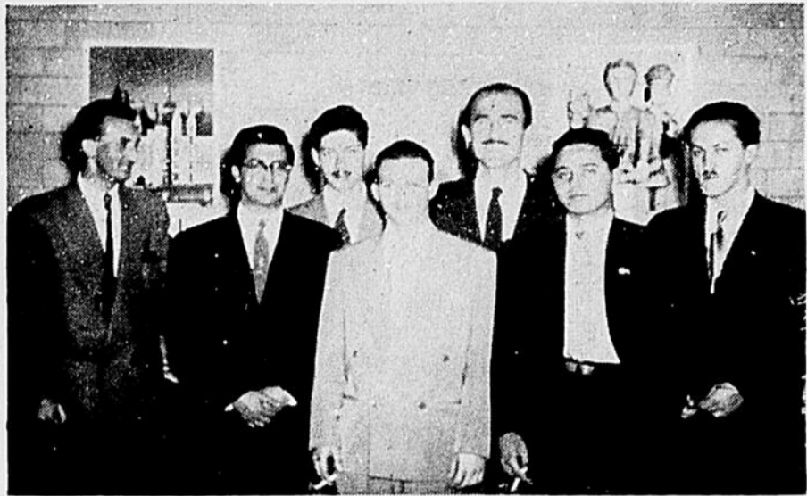
Le président et le directeur reçoivent un groupe de Sud-Américains.