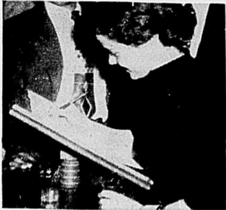
La nouvelle signait . . .