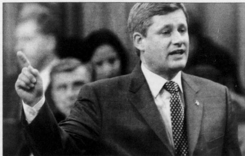
Stephen Harper à la Chambre des communes cette semaine.