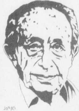
JONAS

Le premier devoir moral, selon le philosophe allemand Hans Jonas, est de se sentir garant de l'avenir de l'humanité.