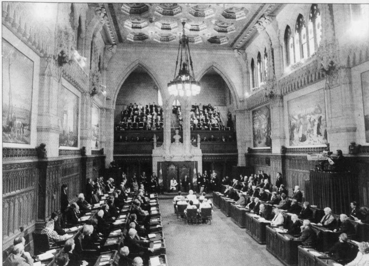
La gouverneure générale s'est rendue au Sénat pour lire le discours du Trône le 4 avril.