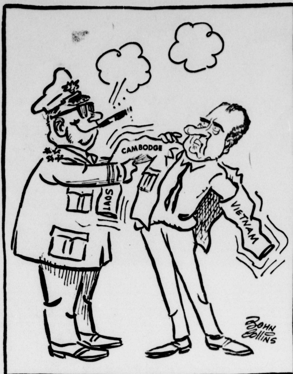
"J'essaie tout simplement de vous aider"