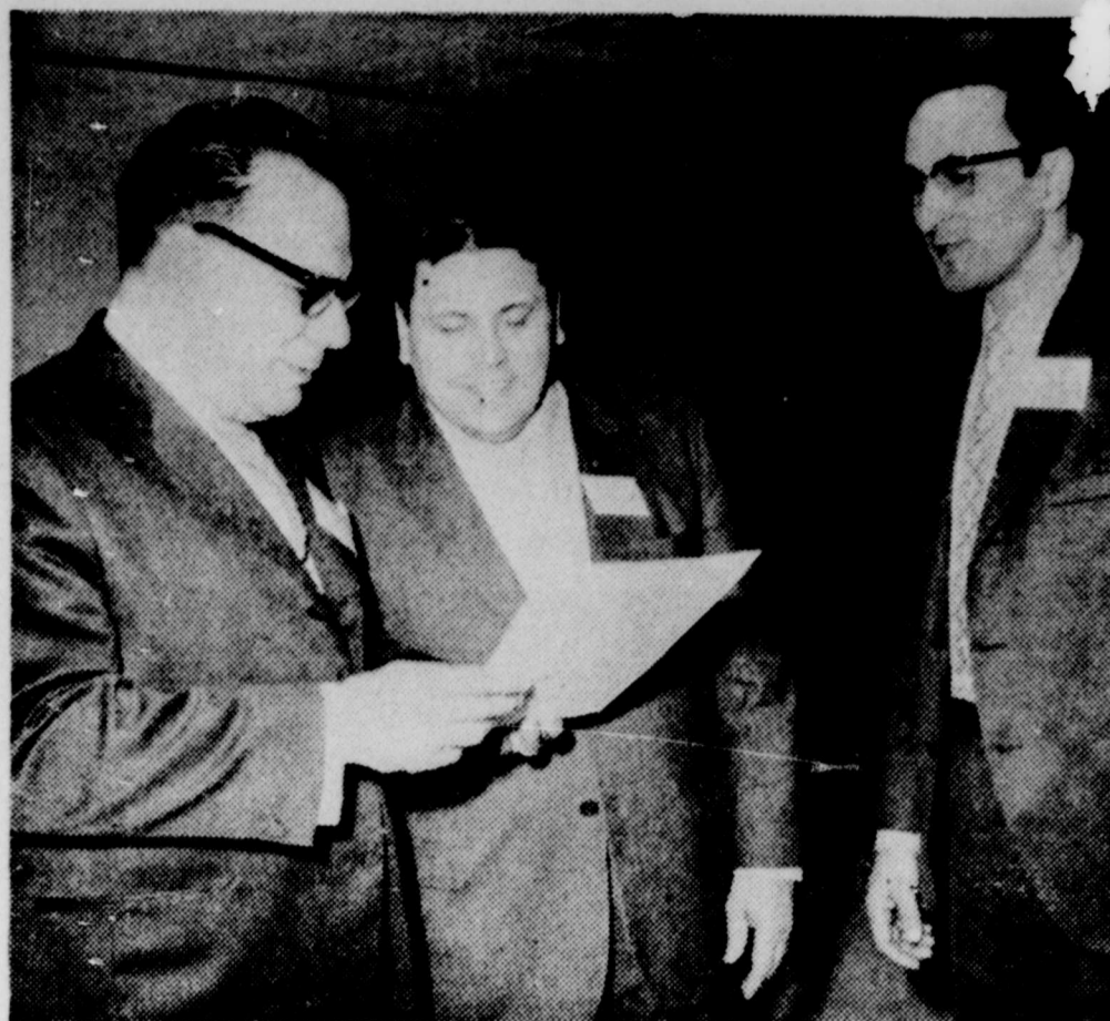
UN COLLOQUE GROUPANT des représentants de trois centrales syndicales a été tenu à Victoriaville en fin de semaine. Ce colloque groupait des participants des régions de Victoriaville, Drummondville et Nicolet. Discutant des conclusions

Une importante campagne publicitaire a été orchestrée à l'occasion du lancement de ce nouvel emblème dans la plupart des imprimés destinés aux consommateurs et à l'industrie afin de sensibiliser le public et de revaloriser ce métier hautement spécialisé de nos jours.