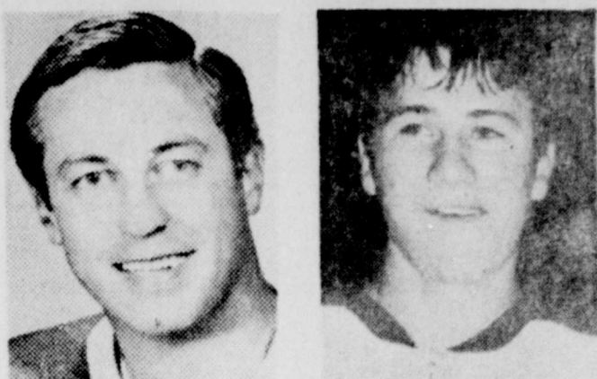
Jean Béliveau Gilbert Perreault