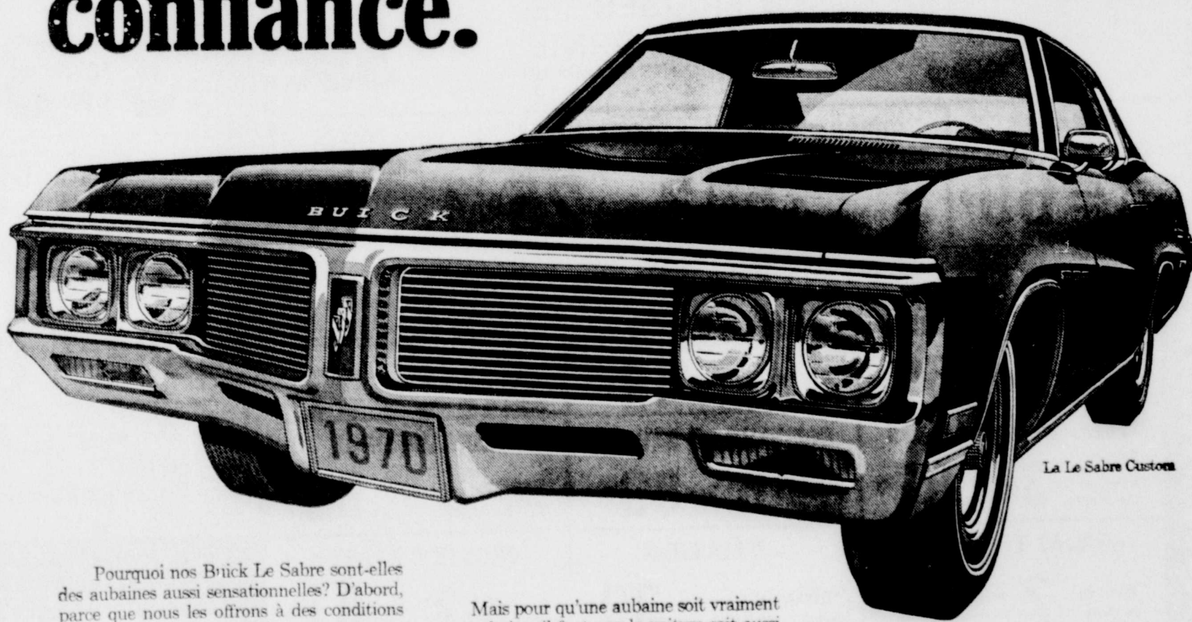
La Le Sabre Custom

Pourquoi nos Buick Le Sabre sont-elles des aubaines aussi sensationnelles? D'abord, parce que nous les offrons à des conditions sensationnelles. Après tout, c'est maintenant le printemps et il nous faut rattraper le temps exemple, le système de refroidissement ne gens pensent plutôt à rester au chaud qu'à acheter des voitures.)