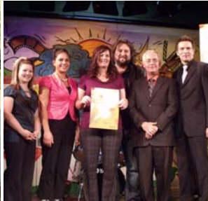
Polyvalente de NORMANDIN

La région a décerné son Prix Essor 2009 au projet « Et toi? » de la Polyvalente de Normandin. Rappelons que le projet prenant la forme d'une pièce de théâtre, scénarisée et mise en scène par une soixantaine de jeunes, qui traitait des conséquences de conduire avec les facultés affaiblies,