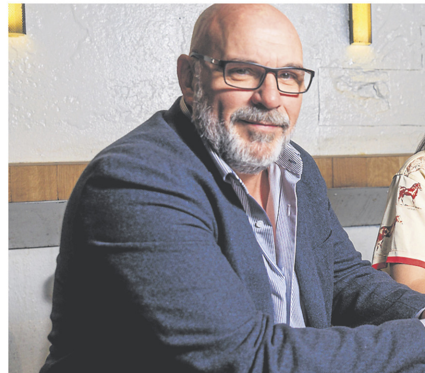
Les acteurs Sylvain Marcel et Sophie Desmarais entourent la réalisatrice du film Les jours heureux, Chloé Robichaud.

« Pour moi, c'est précieux d'avoir quelqu'un qui croit beaucoup à ton travail et qui t'offre quelque chose loin de ta feuille de route », se réjouit la comédienne, qui s'est entraînée pendant deux ans pour apprendre à manier la baguette de façon crédible.