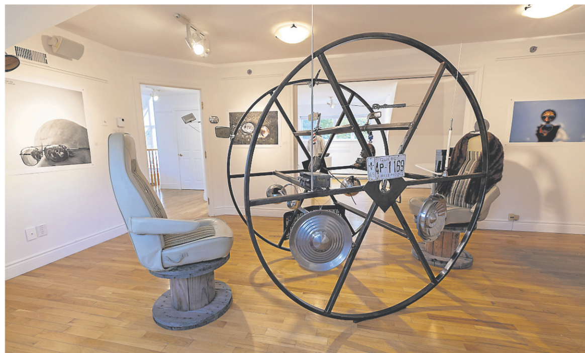
Une immense bobine métallique fait office de voiture au centre de l'exposition.

en parle ouvertement. On a le sentiment que la pandémie a bousculé et fait bouger les gens. On dirait qu'il y a une démarche pour se comprendre soi-même, qu'on trouve relativement saine.»