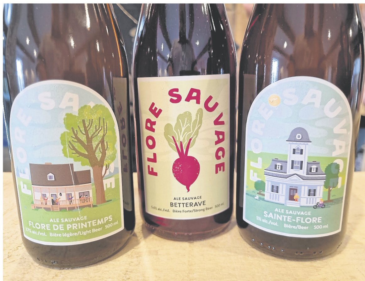
La nouvelle brasserie Flore Sauvage de Grand-Mère propose des bières de type saison aux levures sauvages.

La brasserie ne distribue pas encore ses produits dans beaucoup d'établissements, mais elle offre une petite boutique sur place qui vous permet d'acheter ses dernières créations. C'est d'ailleurs le modèle des nouvelles brasseries artisanales au Québec : brasser à échelle humaine des bières de qualité.