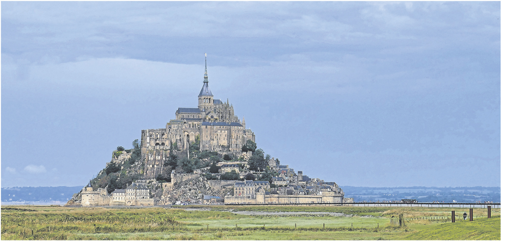
C'est de loin, parce qu'il est imposant, que le Mont-Saint-Michel impressionne le plus.

de moines. C'était au 12 e siècle. Aujourd'hui, un maximum de 12 moines de la communauté