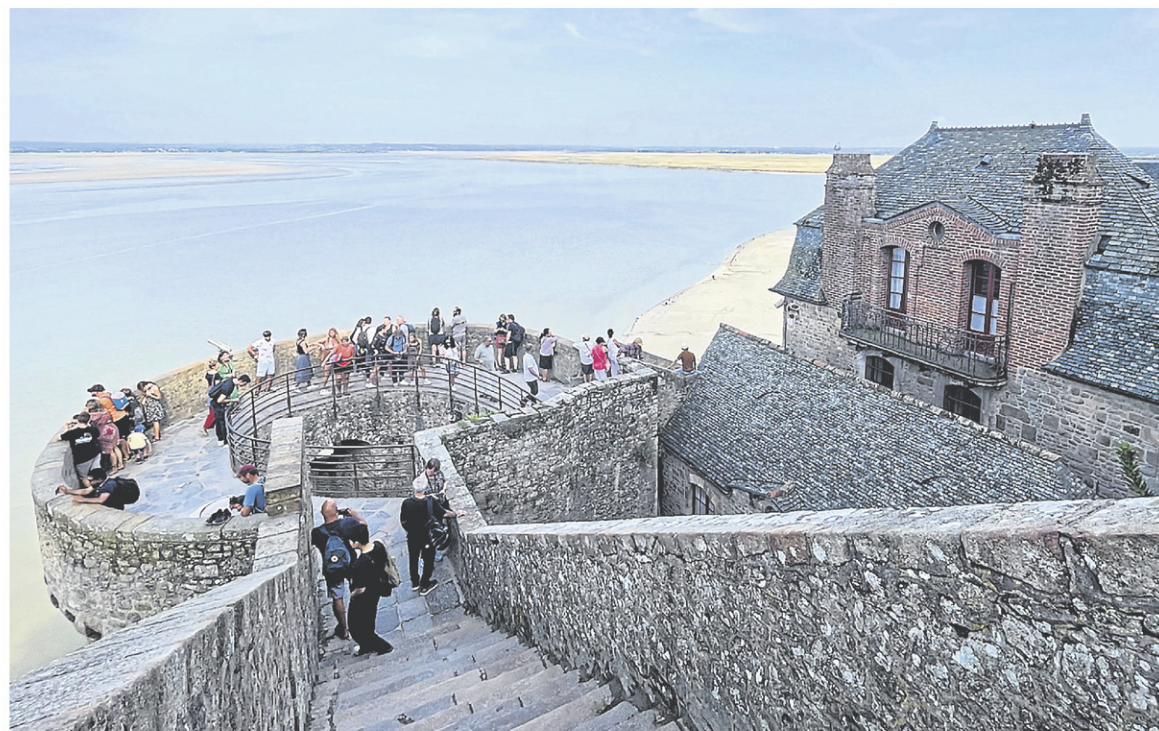
Le Mont-Saint-Michel a la réputation de forteresse imprenable depuis que des remparts ont été érigés pour la guerre de Cent Ans.

À son apogée, le Mont-Saint-Michel comptait une soixantaine