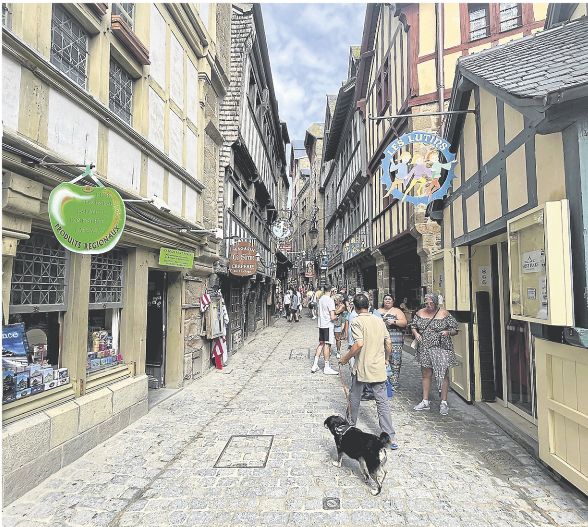
C'est de loin, parce qu'il est imposant, que le Mont-Saint-Michel impressionne le plus.

possible de postuler pour le remplacer. Aujourd'hui, on y compte cinq hommes et sept femmes.