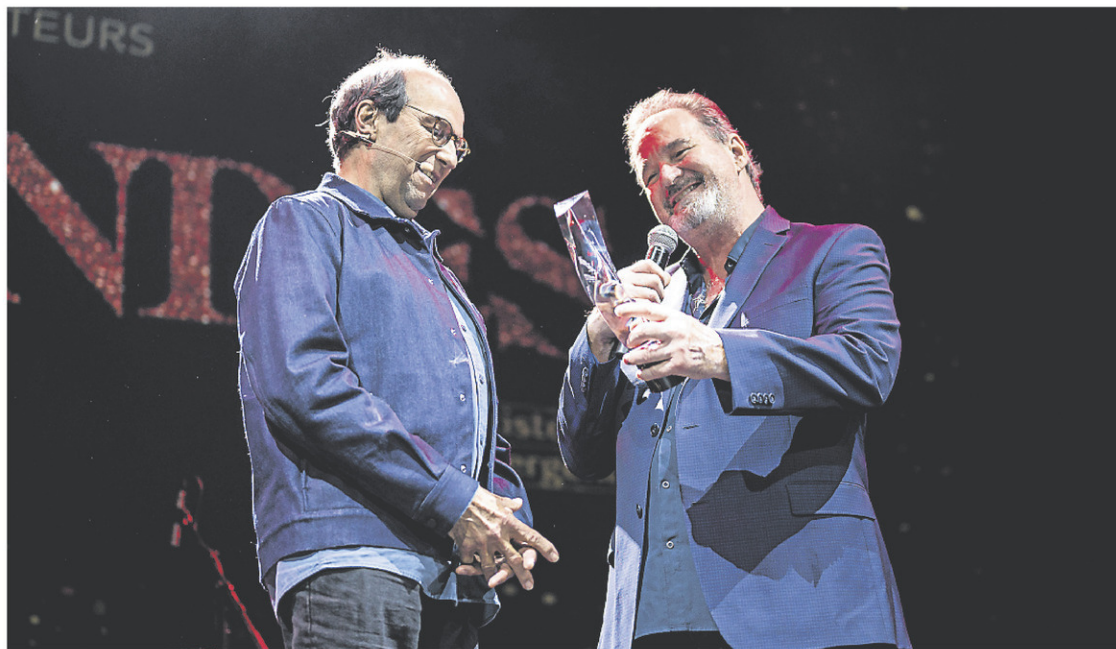
Michel Rivard a reçu des mains de Paul Piché, mercredi soir, le trophée officialisant son entrée au Panthéon des auteurs et compositeurs canadiens de la SOCAN, en même temps que Marjo et Jean Millaire.

intelligent, émouvant, divertissant et qui venait toucher une corde sensible. J'ai trouvé ça le fun de ramener ça et de l'associer à d'autres influences comme Bozo, une chanson fétiche pour moi. Quand j'ai écrit ces deux pièces, je ne l'ai pas perçu tout de suite, mais j'ai constaté après que ça synthétisait tout ça. »