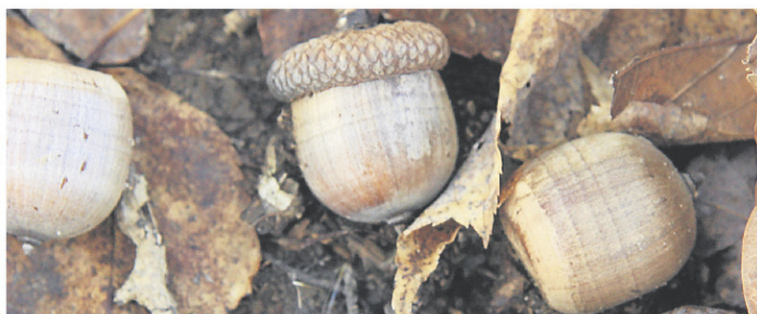
Habituellement, les chênes ne commencent à produire des glands qu'à l'âge de 35 à 40 ans.

R Il est très difficile de transplanter des petits arbres ou arbrisseaux matures de cette taille. Lorsqu'on veut le faire avec succès, on doit garder la motte racinaire intacte autant que possible, mais dans votre cas, vu la proximité d'une