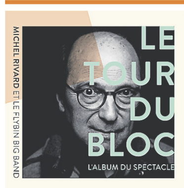
MICHEL RIVARD Le tour du bloc

« On ne peut que dire merci d'être accepté dans un tel club », commente-t-il en riant.