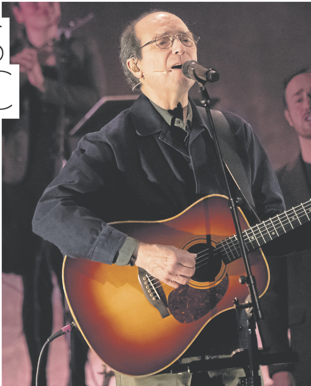
Michel Rivard lors de son passage à la salle Maurice-O'Bready de Sherbrooke le 9 mars dernier. La captation du spectacle a servi à la réalisation de l'album double Le tour du bloc , qui paraîtra le 20 octobre.

« Et depuis L'origine de mes espèces , poursuit-il, je travaille avec un metteur en scène