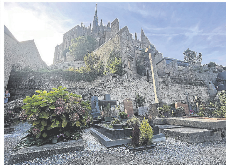
Le cimetière du Mont-Saint-Michel offre une vue différente de l'abbaye.

J'ai choisi la deuxième option. Comme s'il ne fallait pas déballer le cadeau trop vite. Comme pour prendre le temps de bien le toiser, cette abbaye qui défie le temps et qui constitue une prouesse d'architecture. Et en vérité, pour s'en mettre plein les yeux, c'est bien de là qu'il est le plus impressionnant : de la passerelle qui relie le rocher au reste du continent. Aussi bien prendre son temps. Seulement, le soleil et les moustiques peuvent constituer des irritants.