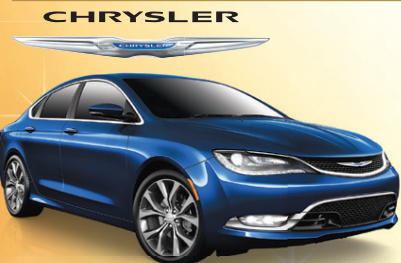
Prix de départ du modèle Chrysler 200C 2015 montré : 26 850 $**