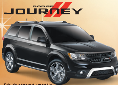
Prix de départ du modèle Dodge Journey Crossroad 2015 montré : 30 750 $**