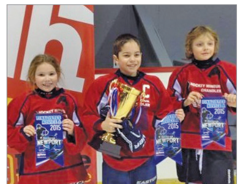
Finaliste Novice A : Global Média de Chandler.