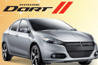
Prix de départ du modèle Dodge Dart GT 2015 montré : 23 850 $**