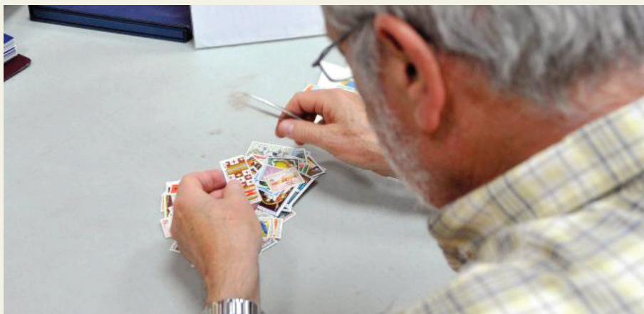
La collection de timbres est toujours aussi populaire. La philatélie attirerait même trois collectionneurs sur cinq.