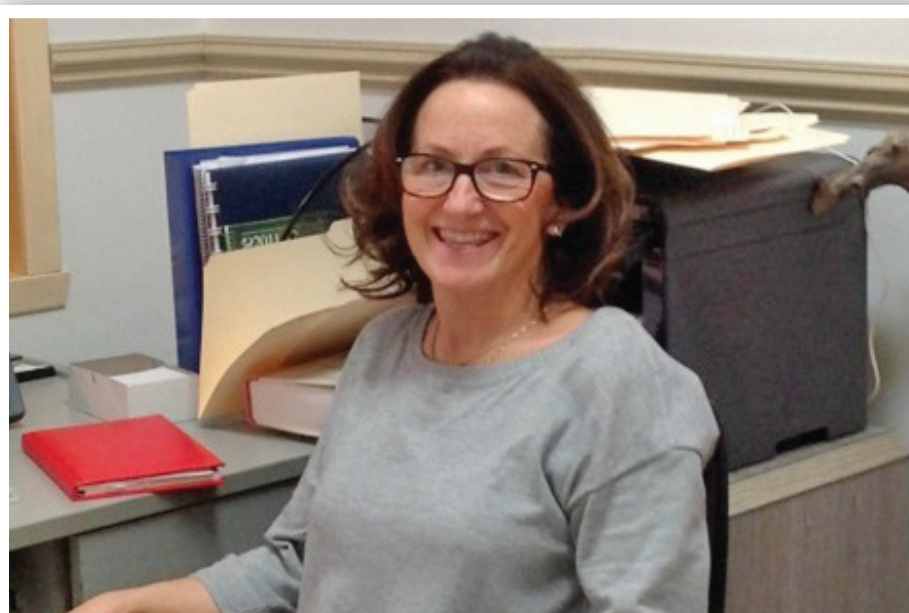
En ce mois de sensibilisation à la maladie d'Alzheimer, je m'adresse à vous à titre d'intervenante de la Société d'Alzheimer, région Gaspésie-Îles-de-la-Madeleine, plus spécifiquement pour la MRC Rocher Percé.

Maintenant qu'elle sait, maintenant qu'elle comprend, qu'elle le partage avec ses proches, qu'elle accepte nos bons soins, elle va pouvoir poursuivre sa route malgré ta présence. Que dis-je? En ta présence! Je sais que tu auras raison de sa raison, mais pas de l'amour que nous lui portons. Je m'accroche ainsi à la pensée que toi, Alzheimer, tu n'as pas de prise sur l'Amour. Je fais le vœu que nous sachions toujours retrouver mon amie sur le chemin du cœur. Je sais que