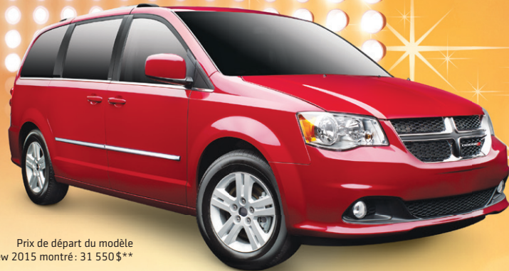
Prix de départ du modèle Dodge Grand Caravan Crew 2015 montré : 31 550 $**