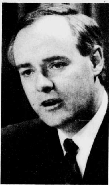
Perrin Beatty, ministre de la Santé nationale et du Bien-être social

fédérales pour l'assurance-maladie et l'enseignement postsecondaire miment encore plus l'esprit de collaboration qui doit régner dans les rapports entourant des programmes essentiels à la santé et au bien-être des Canadiens.