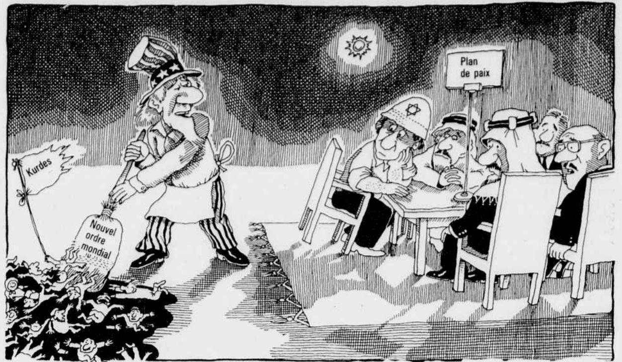
Pas d'inquiétude, je vais vous protéger vous aussi!

Les Canadiens doivent souvent se tourner vers le bien-être social lorsqu'ils perdent leur emploi, lorsque leur mariage s'effondre ou lorsqu'ils sont malades ou handicapés, situations essentiellement imprévisibles et