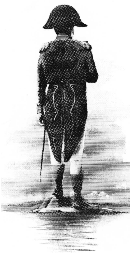
Les Français s'intéressent à Napoléon par cycles. Et en ce moment, ça tourne à la « napoléomania ».

Jugez plutôt : alors que la télévision publique diffusait en octobre Napoléon , la fiction télévisée la plus chère jamais tournée en France avec dans le rôle titre un Christian Clavier très discuté, Robert Hossein et Alain Decaux attirent les foules avec leur spectacle géant C'était Bonaparte , grande fresque lyrique sur l'épopée du général. Clémentine Célerié joue sur les planches Madame sans gêne , tandis que le film Monsieur N. d'Antoine de Caunes incarné par Philippe Torreton sortira en février et qu'un autre Napoléon de Patrice Chéreau, avec Al Pacino, est attendu sur les écrans. Ajoutez à cela l'avalanche de livres, de dossiers spéciaux et de hors série dans la presse et vous comprendrez qu'il est impossible d'échapper à la