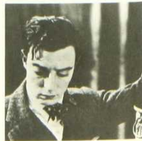
Sportif par amour. Comédie réa-