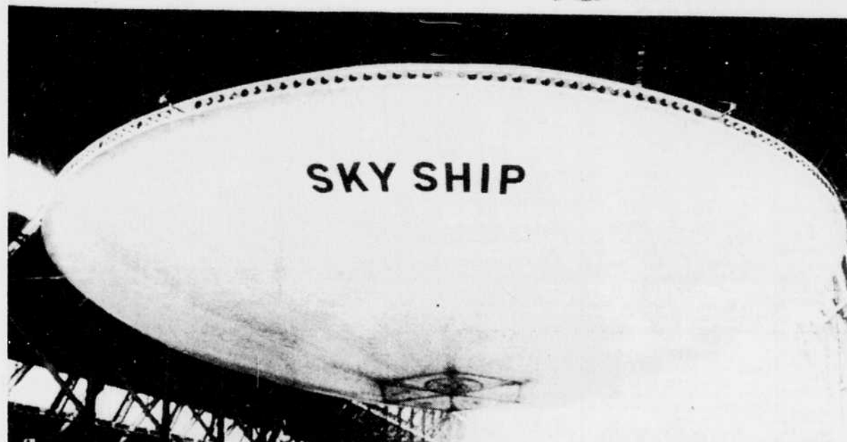
Le dirigeable THS 100 en forme de soucoupe volante