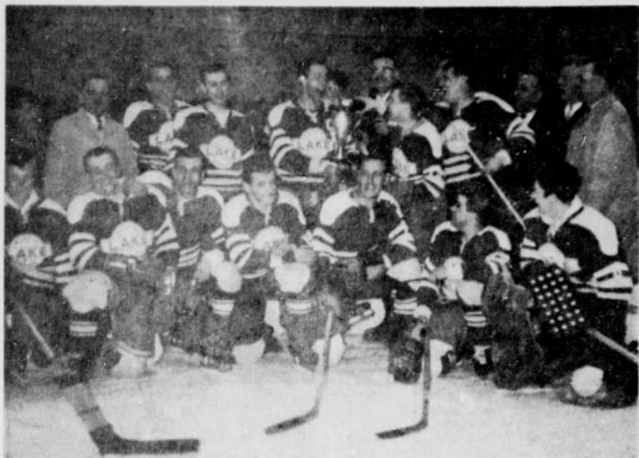
LES NOUVEAUX CHAMPIONS DE LA LIGUE COMMERCIALE DES MINES — Le club Lake Asbestos a été couronné champion de la ligue Commerciale des Mines en défaisant en quatre parties consécutives le club ACL Asbestos, dans la série finale. Les vainqueurs se sont mérité la coupe Penhale. Sur la photo ci-haut, on remarque les porte-couleurs du Lake qui célèbrent à leur façon après le quatrième match qui s'est terminé 11 à 1 en leur faveur.