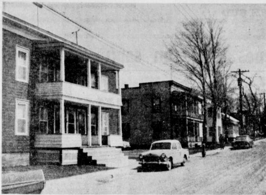
SECTEUR COMMERCIAL — Ces résidences situées sur le côté sud de la rue St-Jacques, à Granby, seront bientôt démolies et feront place à de nouvelles constructions commerciales en face du centre d'achats Plaza Granby, actuellement en construction.

GRANBY, (FA) — D'importantes transactions qui transformeront quasi complètement l'aspect actuel de la rue St-Jacques, entre les rues St-Charles sud et St-Antoine sud, viennent d'être effectuées par deux compagnies montréalaises.