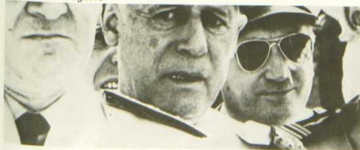
La Guerre d'Algérie