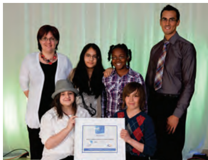
Prix Persévérance scolaire remis par Réussite Laval - CRÉ de Laval - 500 $ Projet : Projet d'embellissement de la bibliothèque (École Arc-en-ciel)