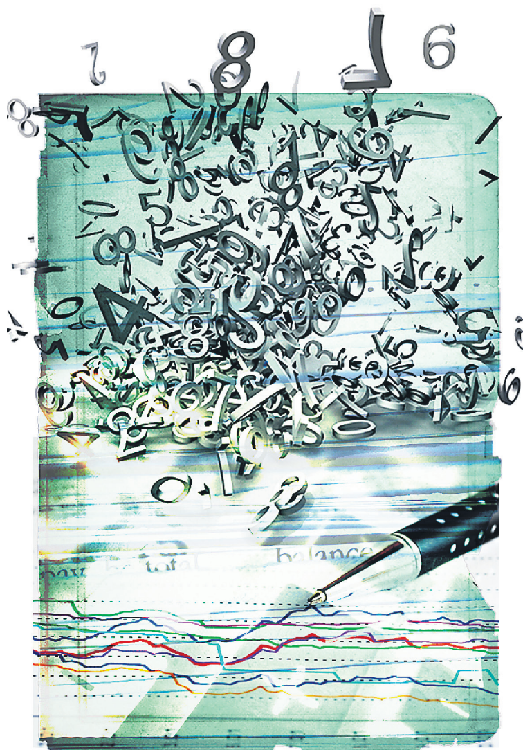
ILLUSTRATION DANIEL RIOPEL, LA PRESSE

LA SUITE DE NOTRE DOSSIER EN PAGES 6 À 8