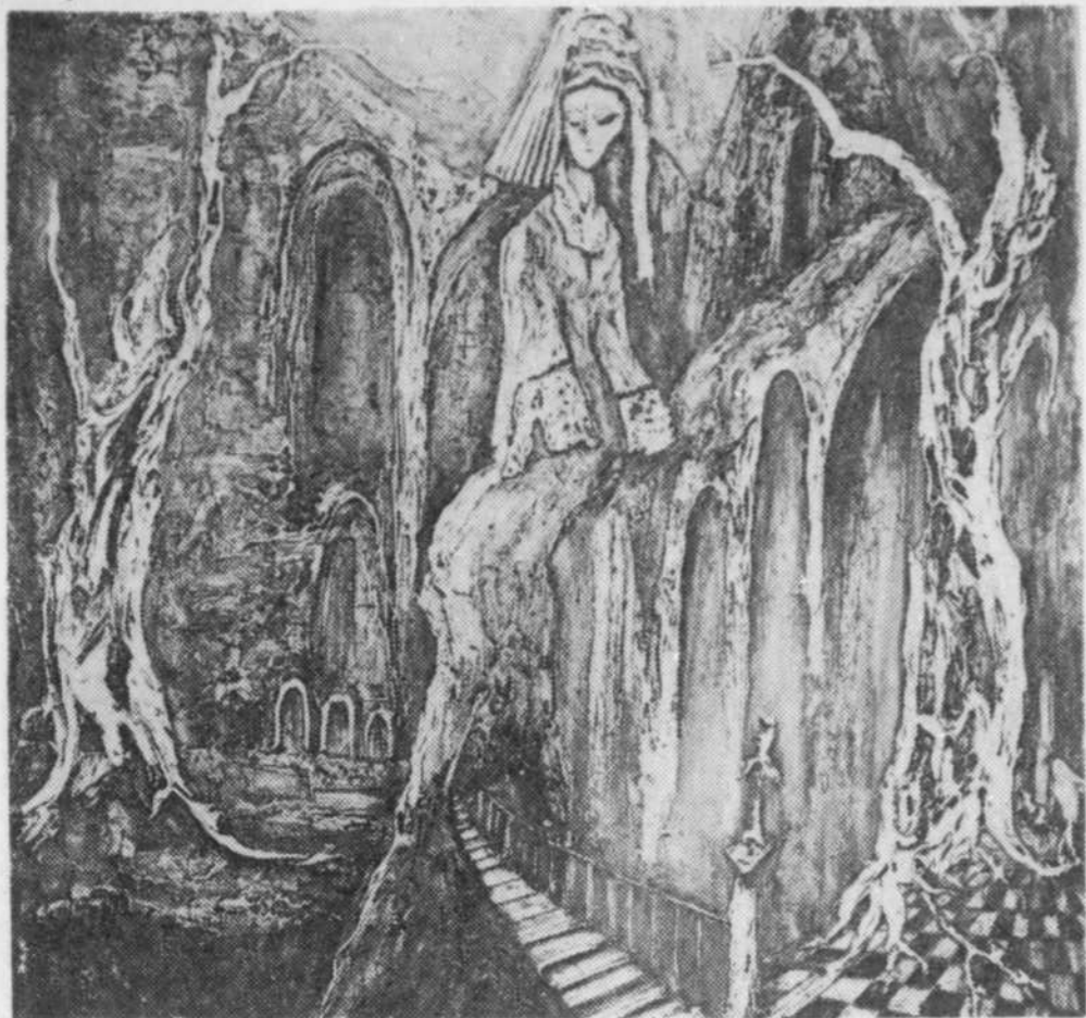
Le peintre Jean Laforge tiendra une exposition de ses œuvres du 26 au 30 à la Bibliothèque du CEGEP de Victoriaville.