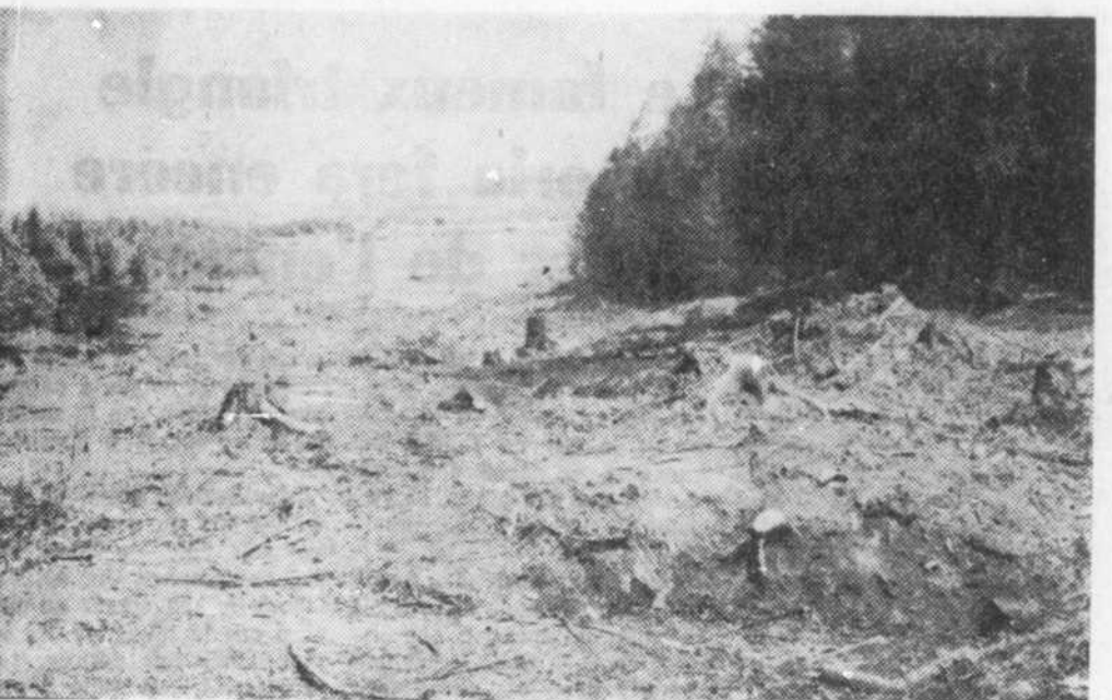
Les travaux du tronçon de la Transquébécoise vont bon train près de Bromptonville. Sur cette photo on remarque une partie du déboisement qui a été effectué au cours des dernières semaines. Présentement on s'affaire à tracer le parcours qu'empruntera cette nouvelle route qui devrait, semble-t-il, se relier à la rue Laval à Bromptonville.