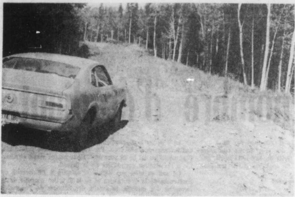
LA FIN DU VOYAGE — C'est ici que s'achève la partie carrossable du chemin de ceinture du lac Mégantic. Commencé en 1963, ce chemin a reçu des améliorations successives jusqu'en 1969 mais, depuis deux ans, rien n'a été fait et une section d'environ un mille qui restait à compléter est dans le même état qu'il y a huit ans. Toutefois, la Voirie provinciale aurait l'intention de terminer l'an prochain le travail commencé.