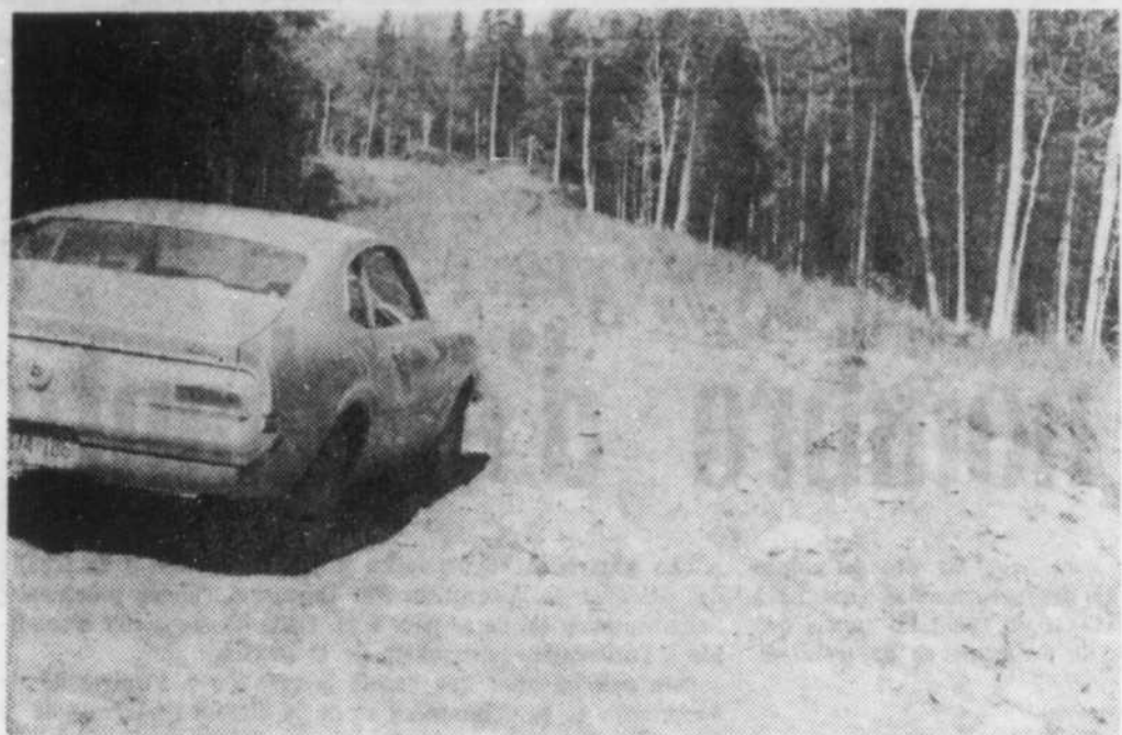
LA FIN DU VOYAGE — C'est ici que s'achève la partie carrossable du chemin de ceinture du lac Mégantic. Commencé en 1963, ce chemin a reçu des améliorations successives jusqu'en 1969 mais, depuis deux ans, rien n'a été fait et une section d'environ un mille qui restait à compléter est dans le même état qu'il y a huit ans. Toutefois, la Voirie provinciale aurait l'intention de terminer l'an prochain le travail commencé.