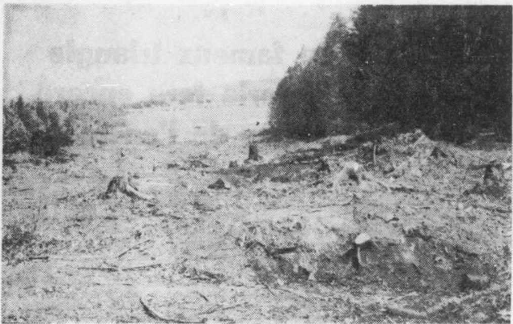
Les travaux du tronçon de la Transquébécoise vont bon train près de Bromptonville. Sur cette photo on remarque une partie du déboisement qui a été effectué au cours des dernières semaines. Présentement on s'affaire à tracer le parcours qu'empruntera cette nouvelle route qui devrait, semble-t-il, se relier à la rue Laval à Bromptonville.