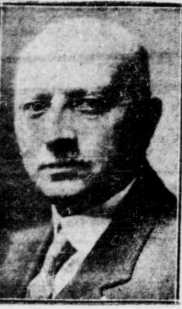
Le chef de police EMILE JOLIAT deservira demain 39 années de service dans les rangs de la Sûreté locale.