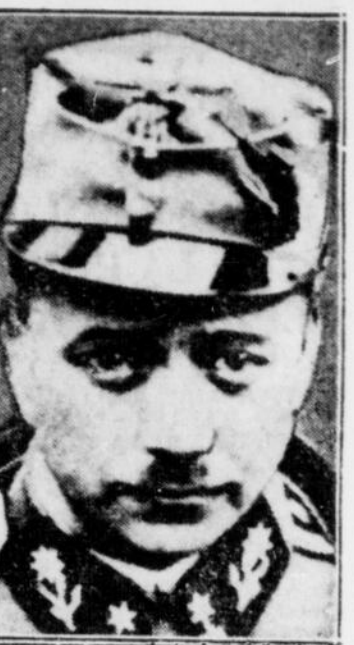
Le chancelier ENGELBERT DOLLFUSS, d'Autriche a été passablement mal reçu à Traz.