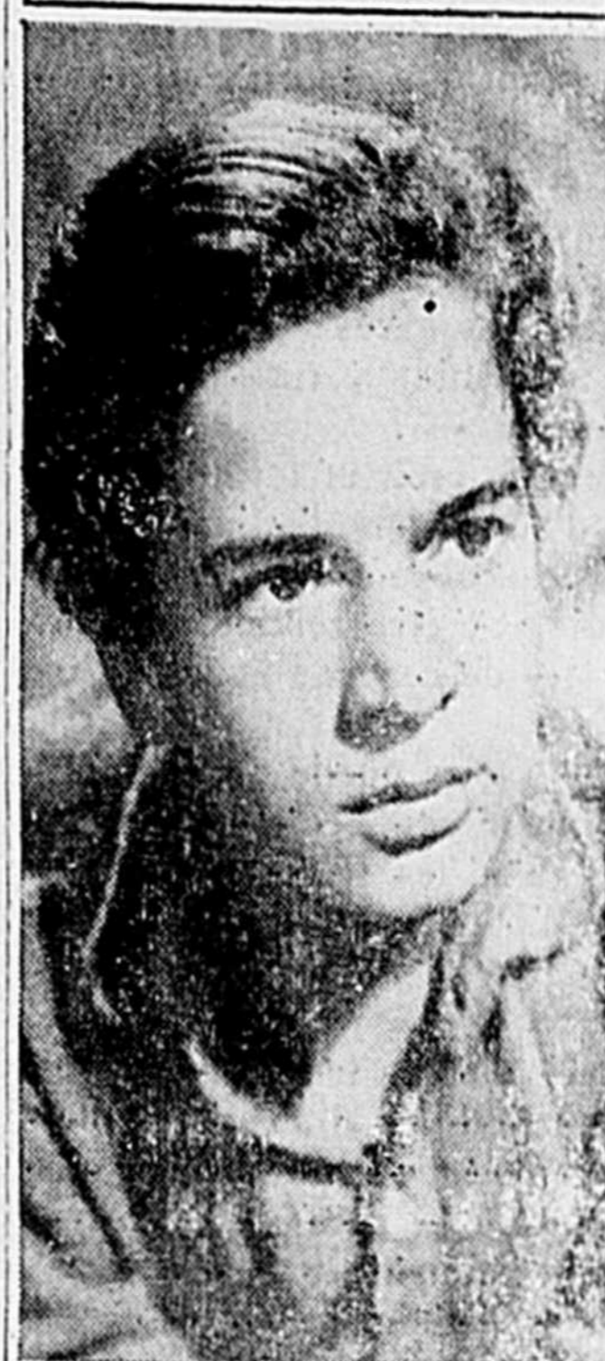
Gene Reynolds made his stage debut at the age of 6 at the Comedy Theatre in Detroit in "We Think We Can". He possessed the most publicized face outside of filmdom, having posed for commercial accounts such as milk and health foods. Gene's latest picture is "Boys Town".