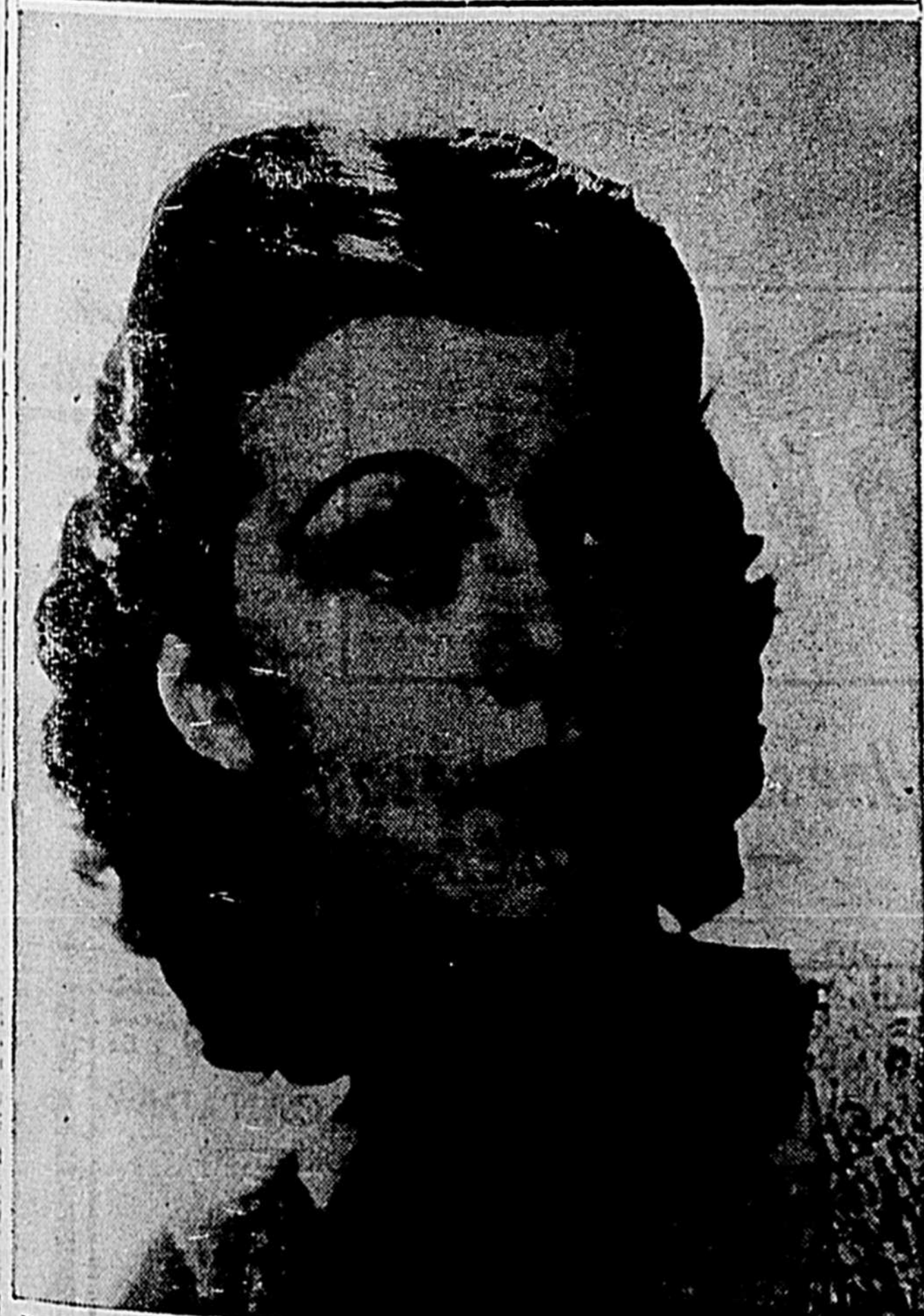
Ruth Hussey, Metro-Goldwyn-Mayer's new leading lady, comes from Providence, Rhode Island, where she appeared over the radio as a fashion commentator. Miss Hussey has appeared in such pictures as "Man-Proof", "Judge Hardy's Children", "Hold That Kiss", "Marie Antoinette", "Rich Man, Poor Girl" and "Spring Madness."