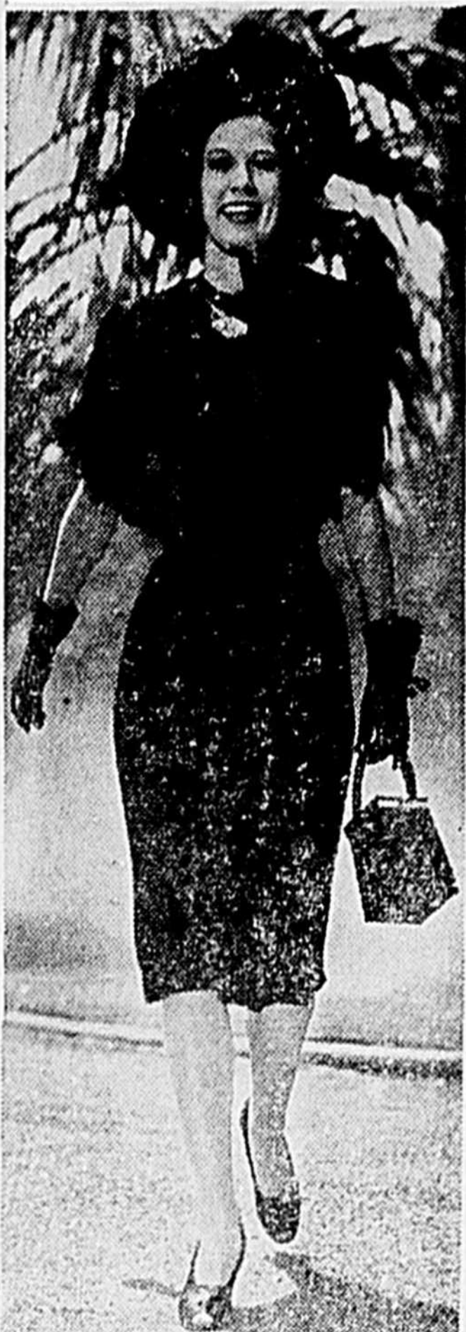
Eleanor Powell wears a monkey jacket of black silk fringe which tops a one-piece black crepe street dress. The rolled hem hit is of black patent, matching bag and shoes.