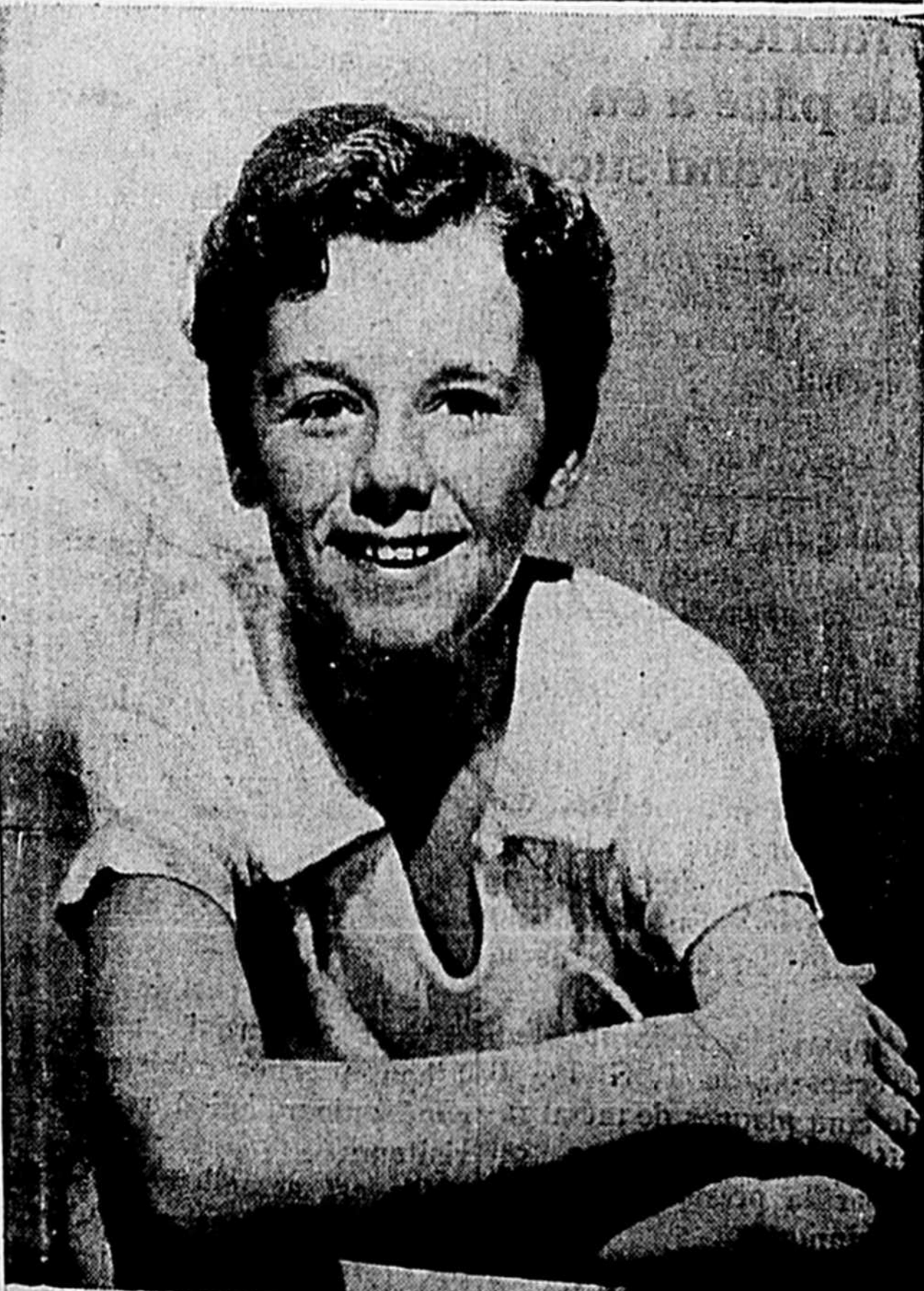
Here is a new portrait sitting taken of Freddie just before he departed from the coast to make a personal appearance tour in the cities of New York, Philadelphia, Pittsburgh, and Providence. Master Bartholomew's latest interest picture is "Listen, Darling" with Judy Garland, Mary Astor, and Walter Fitzgerald.