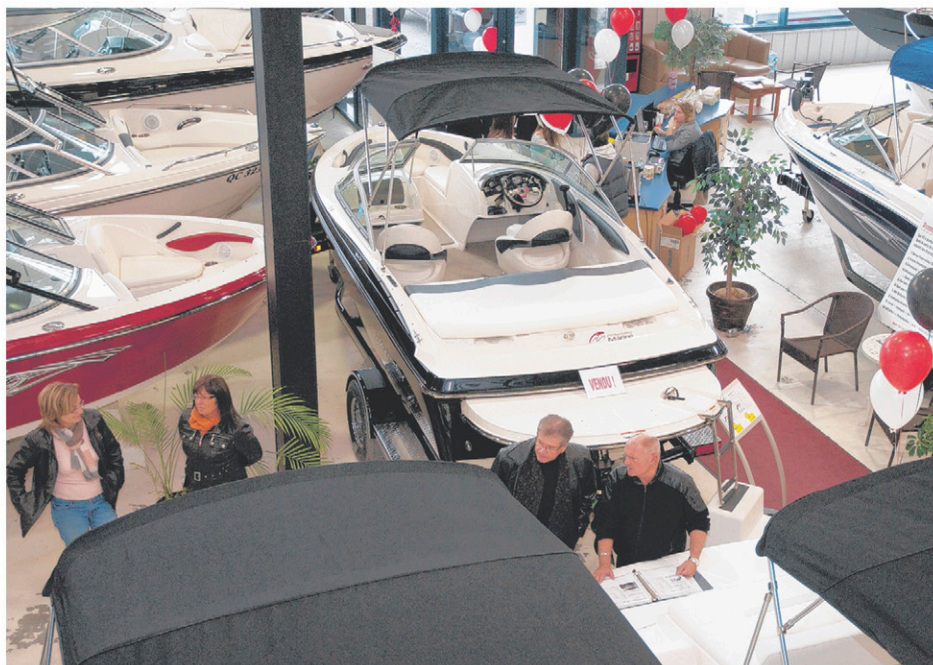
Une vingtaine d'exposants attendront les visiteurs ce week-end.

Il sera possible de discuter avec les experts sur place. Les amateurs de nautisme pourront également effectuer des essais avec plusieurs des modèles présentés.