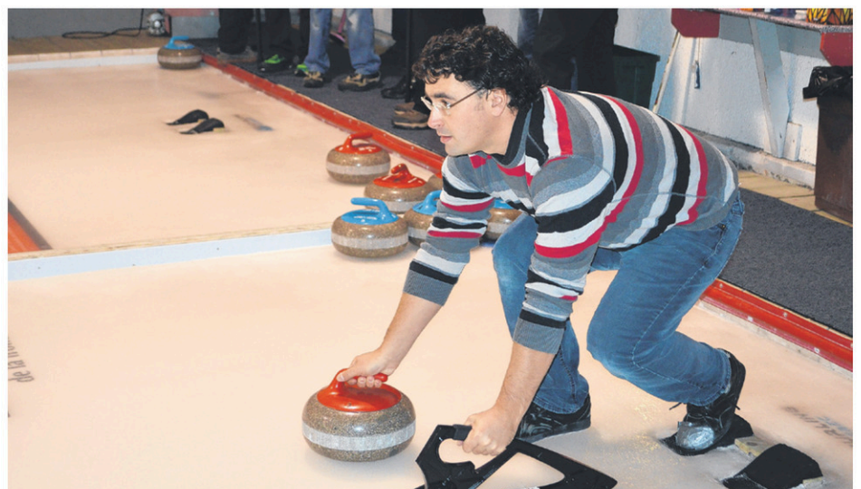
Le curling est beaucoup plus difficile à jouer qu'il n'y paraît. Cela étant dit, l'expérience en vaut vraiment la peine.

Lorsqu'une pierre est lancée par un joueur, ses coéquipiers peuvent, au besoin, balayer la surface glacée pour modifier sa trajectoire. Un coéquipier qui se trouve sur la cible donne ses instructions aux balayeurs, en anglais souvent. « Sweep! Sweep! Hard! Hard! Hard! »