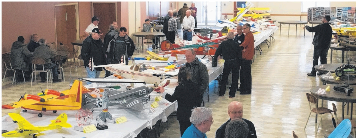
En 2015, l'exposition du Club modéliste Montérégie avait attiré plusieurs centaines de visiteurs à Napierville.