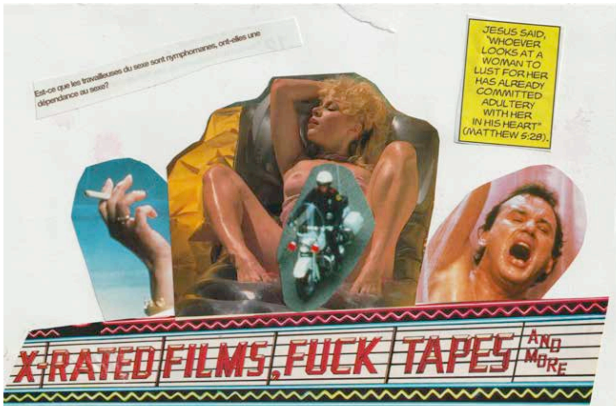
Collage: Adore Goldman

Et c'est pourtant cette même agentivité qui nous est enlevée lorsqu'elle suggère que souvent, en tant que travailleuse du sexe, « c'est tout ce qu'il nous reste » * et « qu'on ne peut pas [nous] voler ça » ** . En effet, une telle affirmation retire aux travailleur.euse.s du sexe (TDS) toute forme d'agentivité en nous victimisant et en dressant un portrait misérabiliste de notre réalité. L'histoire de Léa, décédée après avoir été enrôlée dans un réseau de proxénétisme, inspirée par la vraie vie de femmes ayant été victimes de coercition, d'extorsion, d'abus et d'agressions est valide et alarmante. Il est nécessaire de parler de cette réalité, de la dénoncer. De crier haut et fort qu'en tant que femmes dans un système patriarcal machiste et oppressif, nous avons vécu et vivons encore aujourd'hui des violences sexuelles épouvantables. Dans ce système-là, la violence, comme tu le dis, est partout. Elle est intersectionnelle. Mais je suis tellement à bout que ces histoires d'exploitation fassent systématiquement office de représentation pour la prostitution en général,