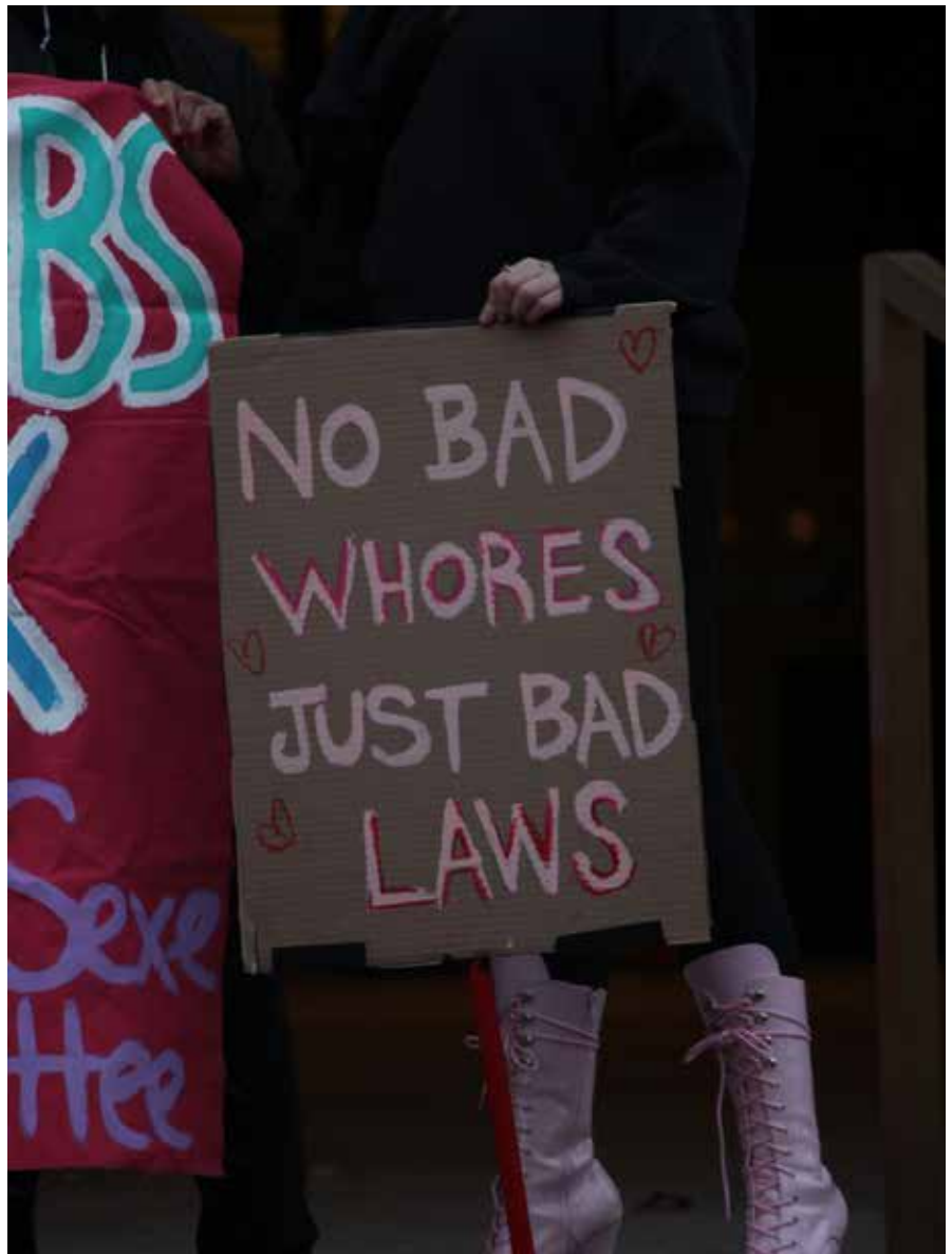
lors d'un rassemblement organisé par le CATS le 7 octobre 2022