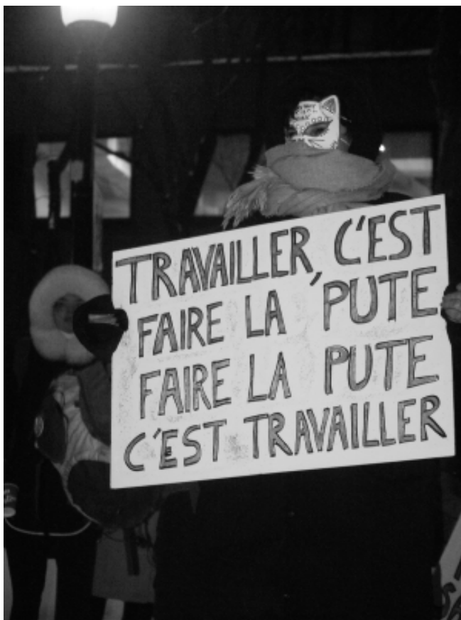
lors d'un rassemblement organisé par le CATS pour la décriminalisation du travail du sexe le 3 mars 2022

Ces conseils sont sujets à changer très rapidement à cause de l'évolution constante du monde en ligne. Notre meilleure arme contre les attaques politiques en ligne reste toutefois la solidarité et l'organisation entre collègues pour obtenir des changements.