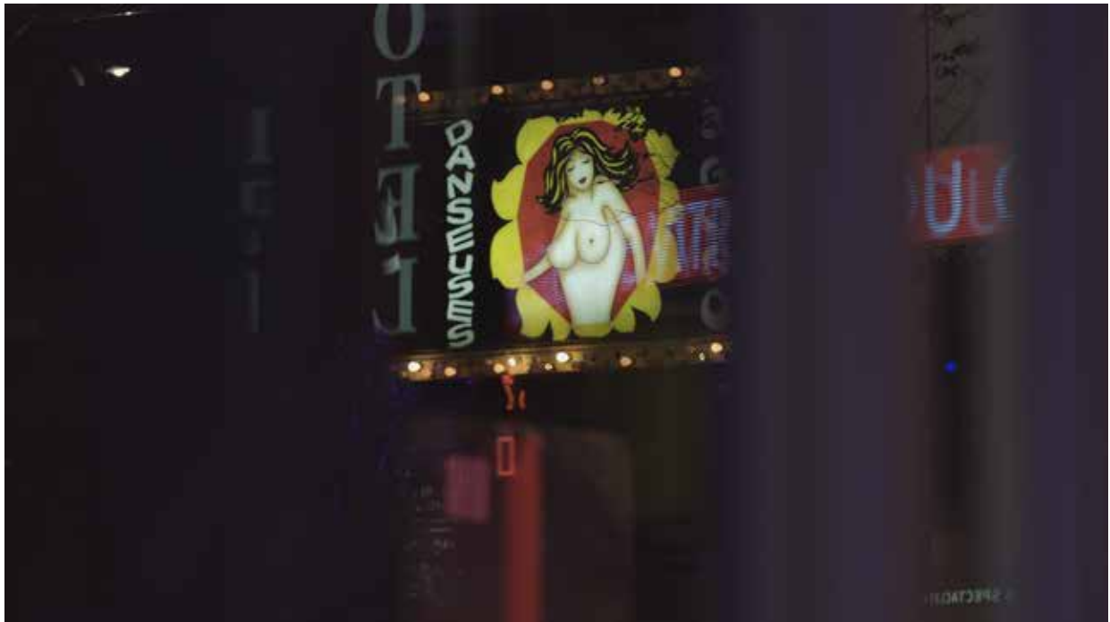
AM Trépanier.(2022). dans le souffle de c. , image fixe, vidéo, Avec l'aimable permission de l'artiste