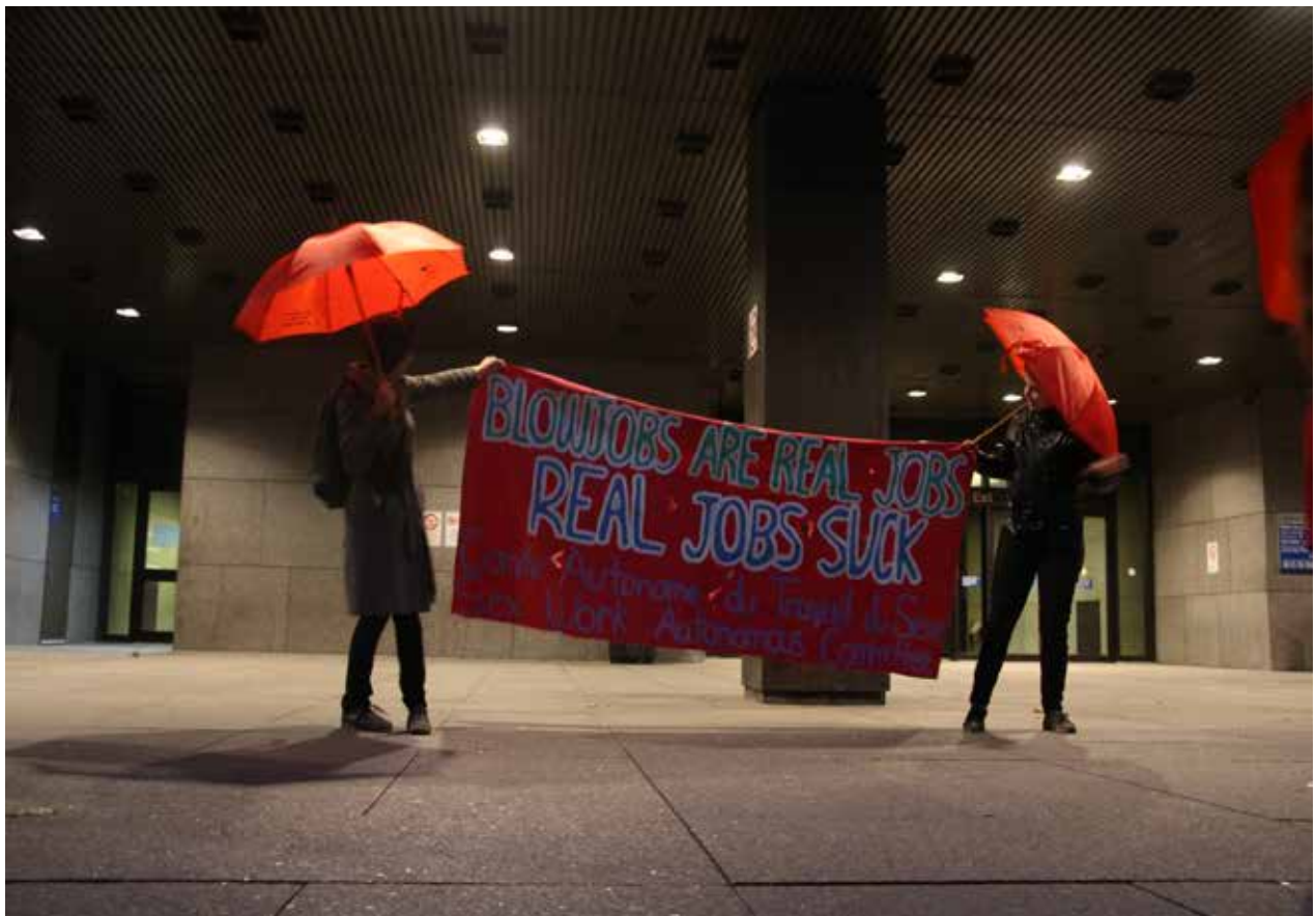
Photo prise par Youssef Baati lors d'un rassemblement organisé par le CATS le 7 octobre 2022

- Le travail du sexe est décrit par certaines minorités comme un moyen d'exercer avec ses pair.e.s. Pour les femmes trans par exemple, et de couleur, de surcroît, cela représente un espace non négligeable dans une société où leurs corps sont sans cesse rejetés, niés, et infériorisés. Pour ceux qui transitionnent physiquement, les coûts des opérations et l'absence de prise en charge financière les pousse à se tourner vers le travail du sexe.