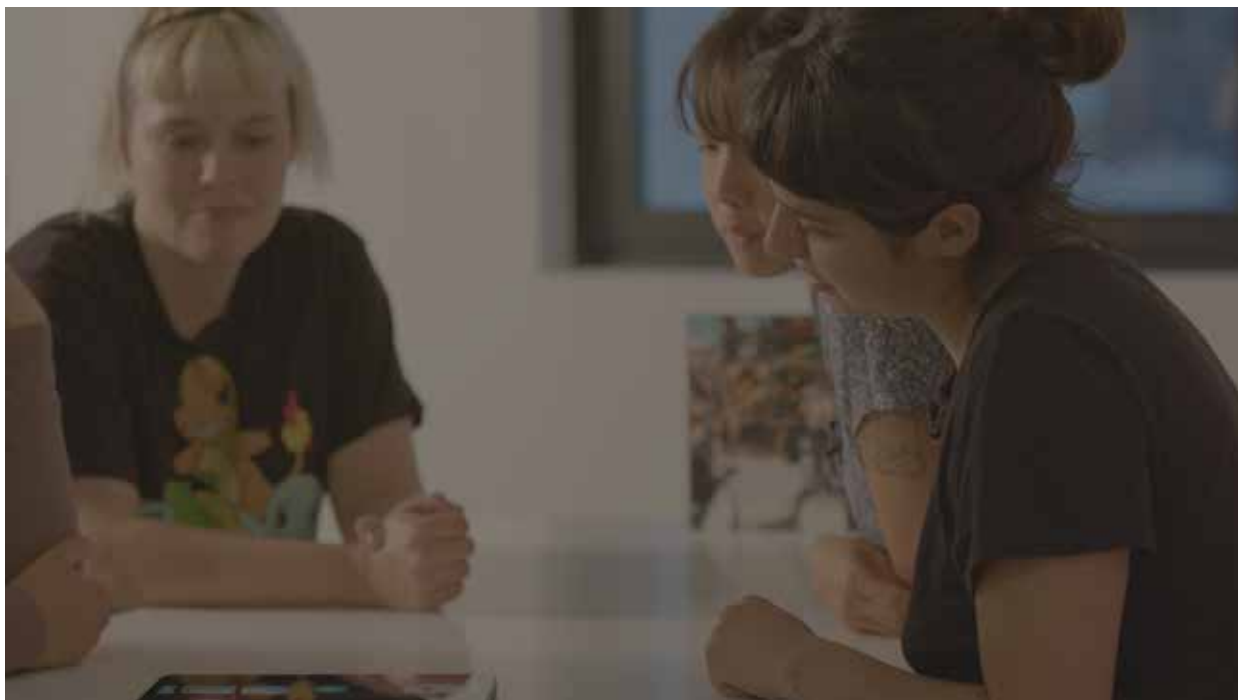
AM Trépanier.(2022). dans le souffle de c. , image fixe, vidéo, Avec l'aimable permission de l'artiste