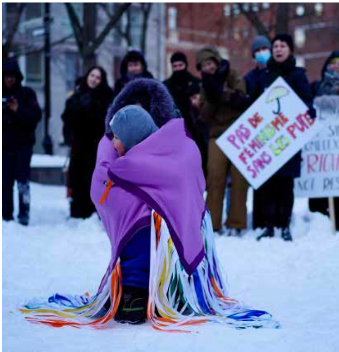
Photo prise lors d'un rassemblement organisé par le CATS pour la décriminalisation du travail du sexe le 3 mars 2022

«Dans notre société, la sexualité est un produit que toutes les femmes sont forcées de vendre d'une manière ou d'une autre. En tant que femmes, notre pauvreté ne nous laisse pas beaucoup le choix. En échange de leurs services sexuels, les putains reçoivent de l'argent en espèces, et les autres femmes, un toit au-dessus de leur tête ou une sortie. Dans les deux cas, il y a un échange, mais ni les ménagères ni les putains ne sont reconnues comme des travailleuses.»*