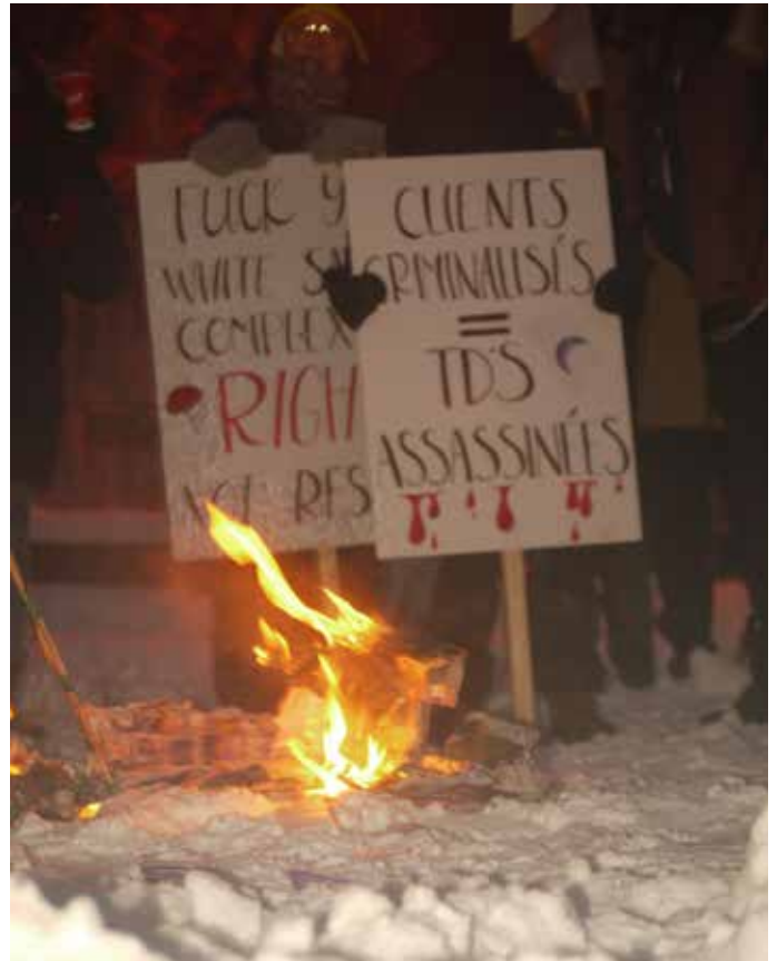
lors d'un rassemblement organisé par le CATS pour la décriminalisation du travail du sexe le 3 mars

La colonisation a également joué un rôle important dans la catégorisation de certaines sexualités comme déviantes. Selon Kim Anderson, professeure et chercheuse cri-métis, les femmes autochtones se voient imposées le complexe de la vierge-putain qui se traduit dans l'imaginaire colonial, en celui de la «princesse-s***».**** D'un côté, la princesse renvoie à la «frontière-vierge [...] qui attend d'être franchie»*****. Sa représentation la plus populaire est sans doute le personnage de Pocahontas.