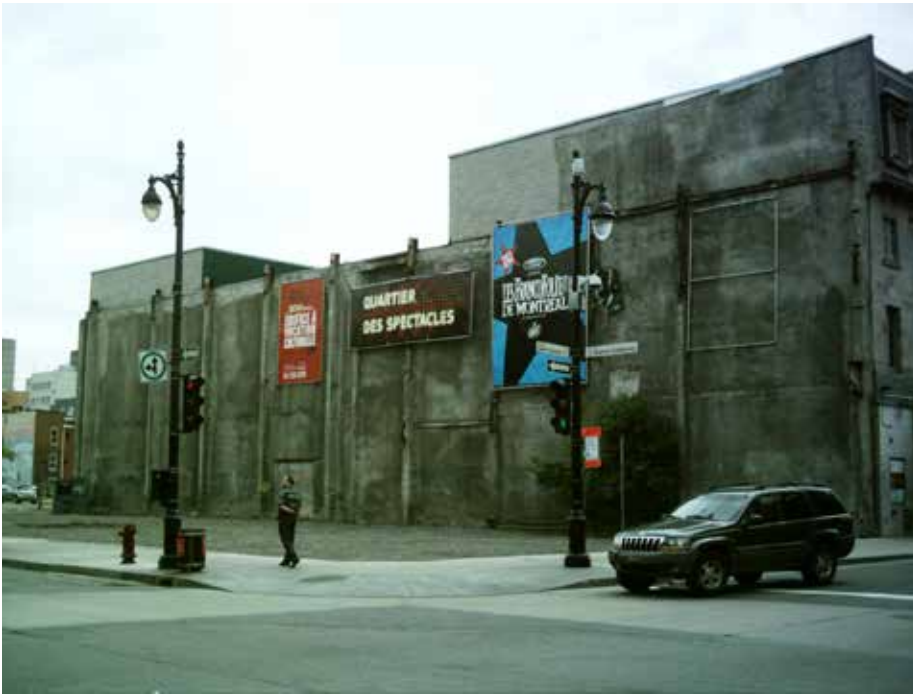
Wikipedia. (s.d.). Terrain vacant du 2-22 en 2008 , récupéré de https://tinyurl.com/terrainvacant

MD: À leurs yeux c'était mort, pourtant ce ne l'était pas. Il y avait des activités, mais qu'ils ne reconnaissaient pas.