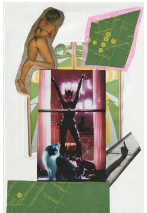
Collage: Adore Goldman

Ce qui m'a le plus marqué dans la discussion, c'est que la gentrification comme phénomène n'est pas juste une question d'espace. Ça commence par le déplacement de communautés, oui, mais les effets vont au-delà de ça. Notamment pour les TDS, il y a l'impact psychologique et relationnel, car ce déplacement affecte leur capacité à se soutenir mutuellement.