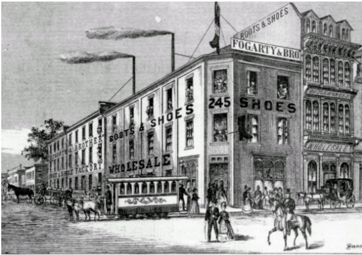
MONTREAL:—FOGARTY & BROS'. WHOLESALE AND RETAIL SHOE FACTORY AND SHOP, CORNER ST. CATHERINE AND ST. LAWRENCE MAIN STREET

Cela dit, comme le projet initial du 2-22 proposait la construction d'un immeuble dépassant la hauteur limite permise par le Plan d'urbanisme de la Ville de Montréal , il devait y avoir une consultation publique afin d'obtenir l'autorisation avant de pouvoir procéder. C'est à ce moment-là que les différents intérêts de la population et organismes impliqués ont pu être cernés. Les différent.e.s intervenant.e.s étaient très divisé.e.s.