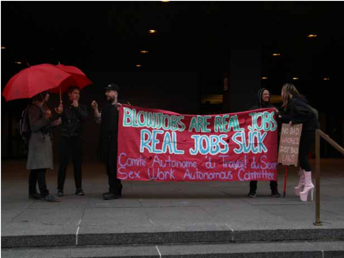
lors d'un rassemblement organisé par le CATS le 7 octobre 2022

V. les motels seront des royaumes comme le vieux banc arrière du char les lits seront des temples et les cigarettes des remèdes dans nos gueules puantes de vivant qui s'embrassent sans arrêt qui mangent la bouche ouverte et qui rient tout le temps