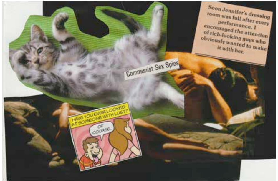
Collage: Adore Goldman

Vous pouvez prendre certaines mesures pour vous protéger, ainsi que vos données : Ces précautions peuvent ne pas être pertinentes dépendamment de votre utilisation d'Internet liée au type de TDS que vous faites ou de vos limites personnelles.