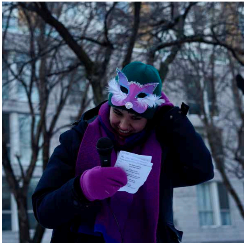
Photo prise lors d'un rassemblement organisé par le CATS pour la décriminalisation du travail du sexe le 3 mars 2022

Ainsi, «les queers deviennent les "dernier.e.s embauché.e.s, premier.e.s licencié.e.s" de la famille... une catégorie facultative de l'armée de réserve de travailleur.euse.s reproductif.ve.s d'une classe ouvrière de plus en plus poussée à se reproduire par elle-même» .** Et dans le contexte d'austérité néolibérale et de la crise de la reproduction sociale dans le Nord globalisé, l'absence de support familial est souvent synonyme d'une grande précarité. Dans les années 60 et 70 des pays enrichis, les gays et les lesbiennes ont énormément profité du contexte économique favorable, caractérisé par le plein emploi, et d'une plus grande sécurité d'emploi pour s'émanciper de leur famille.