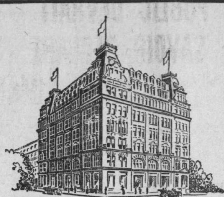
7 MILLBANK, LONDON, ENGLAND

QUATRIÈME COURSE, 6 furlongs. Handicap Vitesse. 3 ans ou plus. Pen Rose, 114 E. Fator. The Desert, 105 Barnes. Happy Go Lucky, 108 M. Faion. Sayona, 102 Thurber. Temps: 1.19. Pari de $2.00 sur Pen Rose a rapporté $4.10 et $2.60, et sur The Desert, $2.50 en troisième.