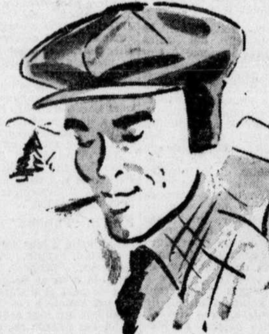
CASQUETTES "INSTRUCTEUR" Gabardine beige, bleu, brun. 2.50 pour le ski.