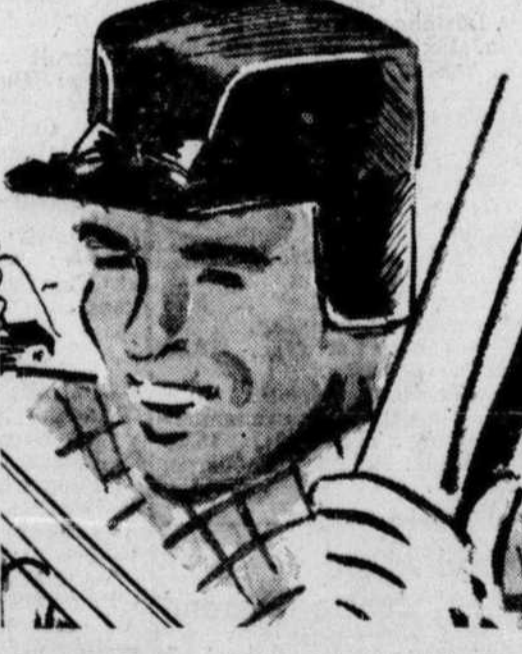
CASQUES "HURRICANE" En gabardine beige, brun, bleu; doublure de finette beige. 2.25