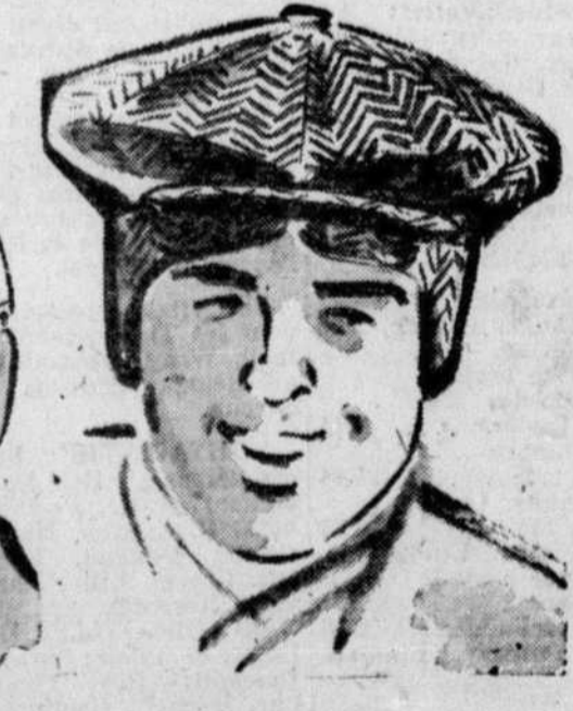
CASQUES "HURRICANE" En tweed gris, brun pour le travail, le voyage; avec cache-oreilles. 1.95