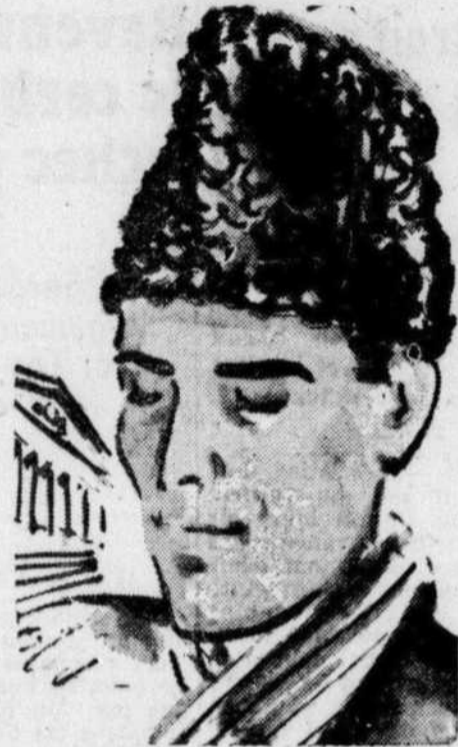
CASQUE véritable mouton de Perse noir, peau complète; intérieur piqué, doublure satin. 25.00