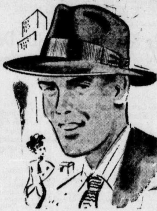
ROYAL STETSON DE LUXE Belle qualité feutre duvet, bordure ruban; le bord se porte bas-sé ou relevé. 12.50