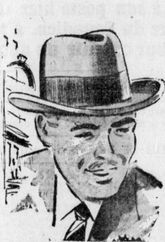
STETSON IMPERIAL Foules duvet HOMBERG; bord relevé, se porta relevé. Bleu-marine 15.00 et brun.