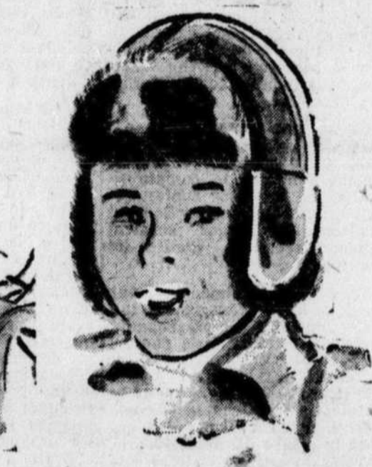
CASQUES "AVIATEUR" Cuir véritable brun avec fourrure brune MOUTON RASE. Pour hommes, 3.95 jeunes gens.