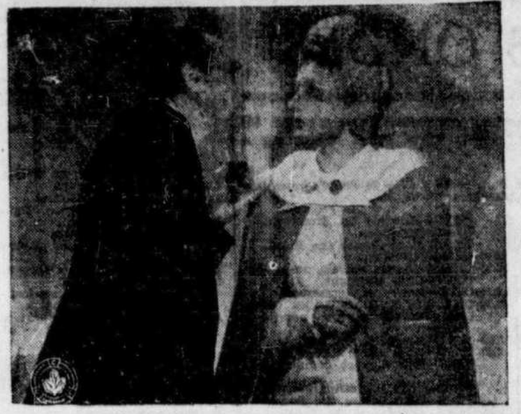
Annie Ducaux et André Luguet, dans "L'inévitable Monsieur Dubois", comédie que le Saint-Denis mettra samedi, à l'affiche.