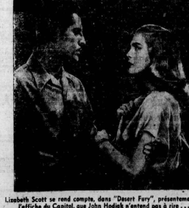
Lizabeth Scott se rend compte, dans 'Desert Fury', présentement à l'affiche du Capitol, que John Hodiak n'entend pas à rire...