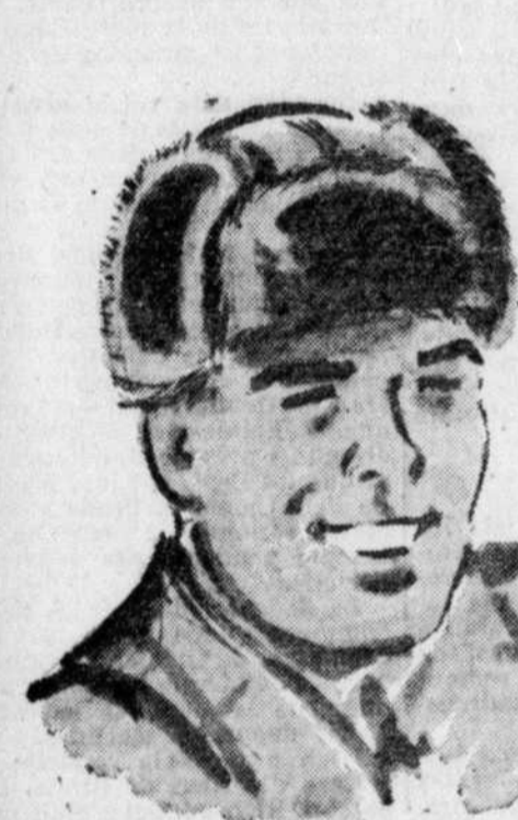
CASQUES "ARTIC" En tissu gabardine beige; revers fourrure mouton rose; pour le 3.95 sport.