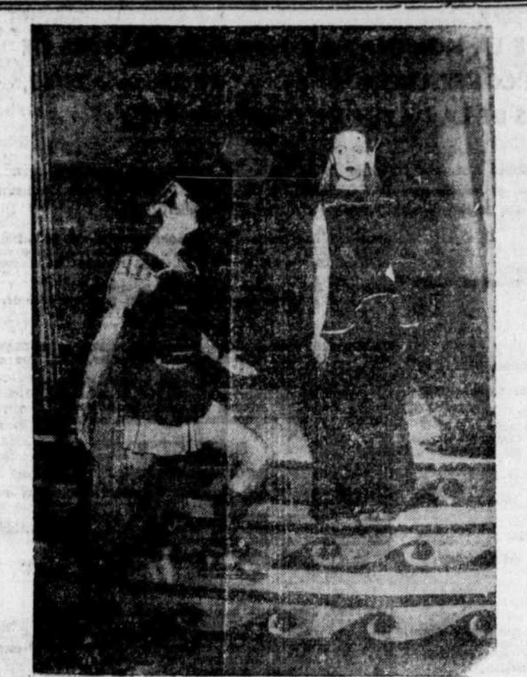
Pyrrhus et Andromaque, dans la pièce de Racine, chez les Compagnons. Ceux-ci attirent des salles nombreuses au Gesu. Dernières représentations: les 27-28 et 29 novembre.