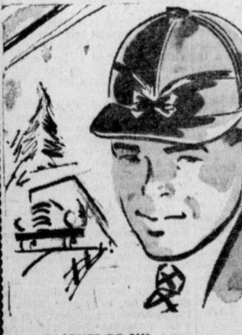
CASQUES DE SKI En molleton marine avec cache-oreilles bien doublé... pour le 2.00 ven.