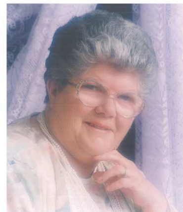
COLLECTION DE KEVIN FROST