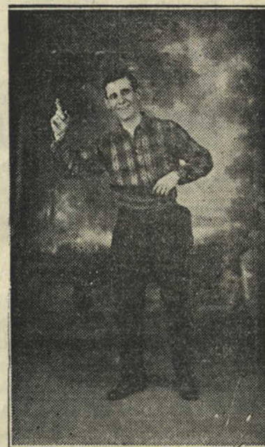
Le Comique ANTOINE

La musette est bien arrosée Et j'applaudis à ses chansons; Avec vos belles fiancées, Sautiez, dansez, joyeux garçons; Car j'aime à voir, etc.