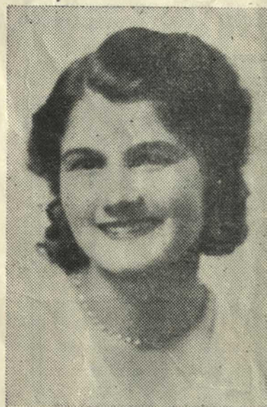
La Jolie Rosine

Bonhomme, bonhomme, si tu jouais (bis) Si tu jouais de ce tambour-là (bis) Bing, bin, ban de ce tambour-là (bis) Flûte, flût'de c'te flûte qui flûte (bis) Zing, zin, zan, de ce violon-là (bis) Bonhomme! (bis) Tu n'es pas maître dans ta maison) Quand nous y sommes. ) bis