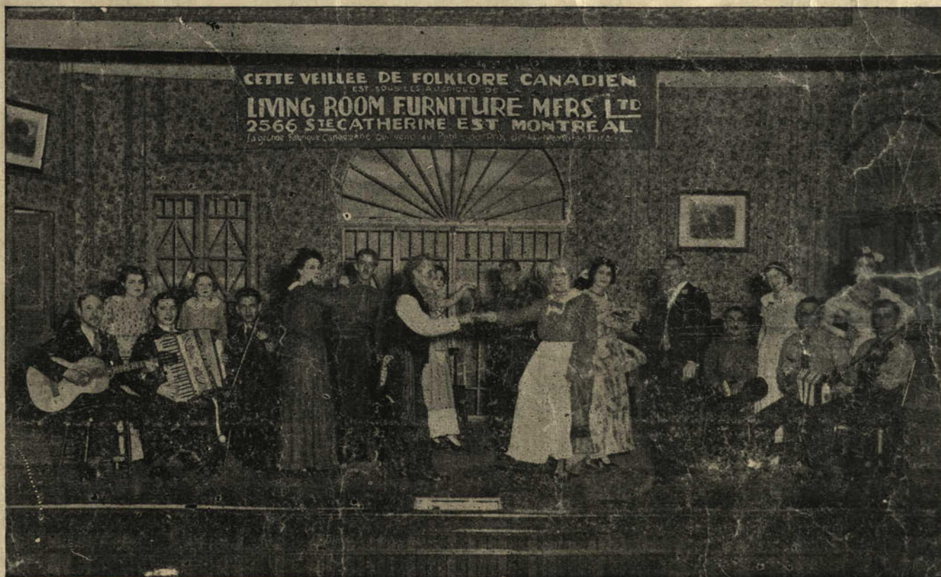
"LES ARTISTES DE LA LIVING ROOM FURNITURE"