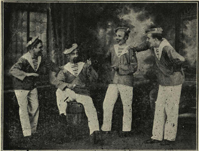
Les Gars de la Marine

Si j'vous paye pas c'printemps Je vous l'devrai tout l'temps!