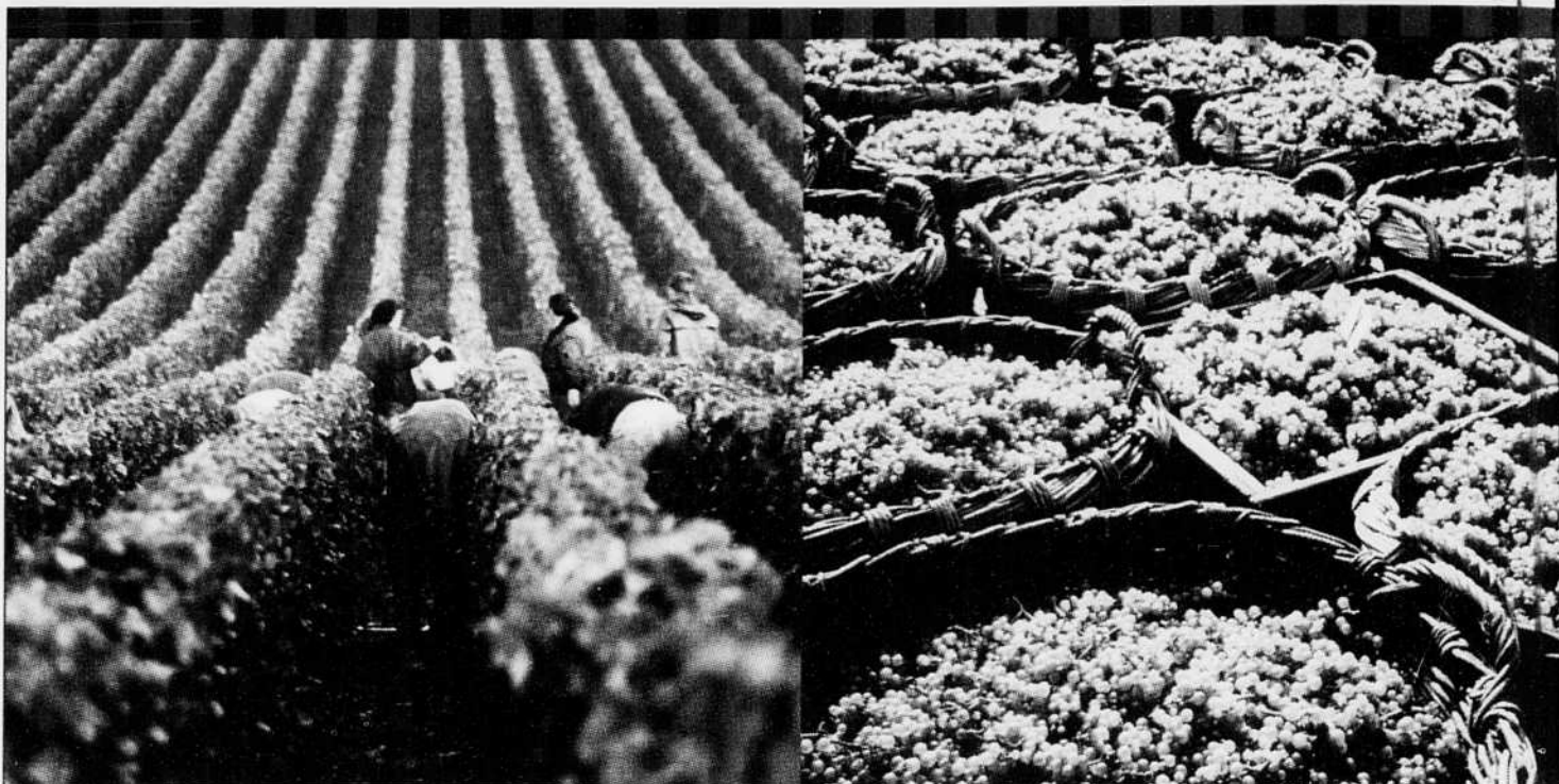
Les vendanges en Champagne, à l'automne.