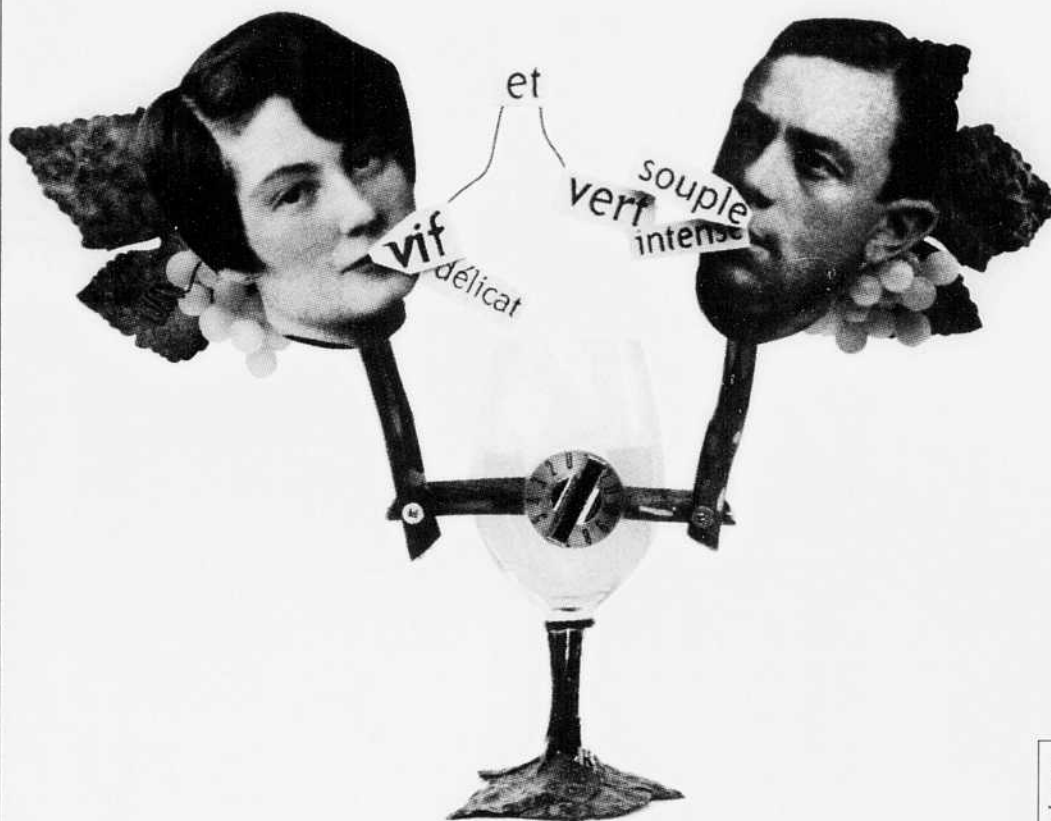
Illustration Katy Lemay