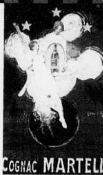
Affiche pour le cognac Martell, réalisée en 1927 par le dessinateur Jean D'Ylen. Une bouteille s'envole entre les ailes des anges...

Les plus vieux types de cognac commercialisés peuvent arborer une étiquette annonçant : X.O,