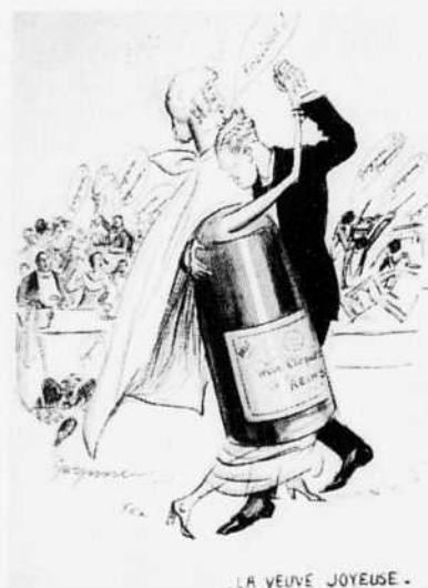
LA VEUVE JOYEUSE.