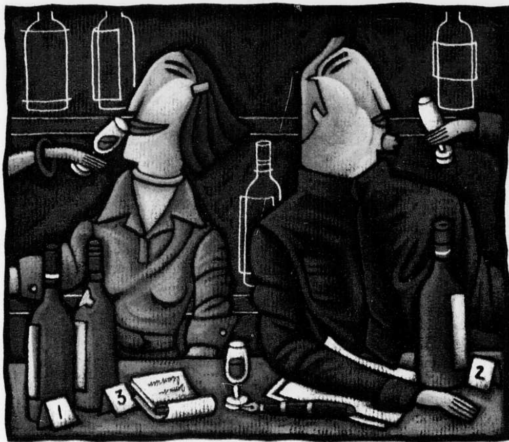
Illustration Sylvie Bourbomière / www.agoodson.com

Car en se prononçant, on apprend à résumer sa pensée, on confronte son jugement avec celui des autres. Et c'est souvent ainsi, à plusieurs personnes, qu'on arrive à bien éva-