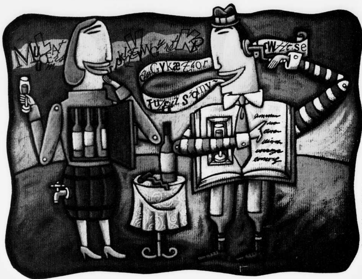
Illustration Sylvie Bourbonnière