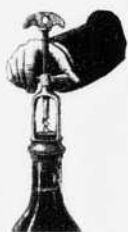
Illustration page couverture Katy Lemay / www.agoodson.com